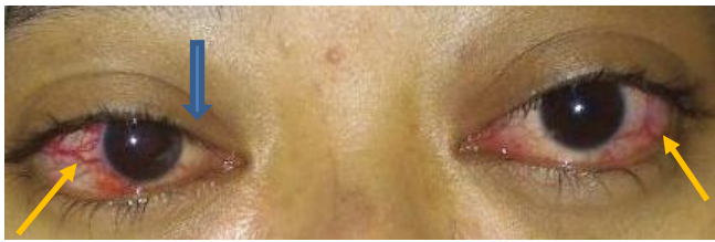
Gambar 1. Proptosis bilateral yang disertai dengan gambaran dilatasi pembuluh darah konjungtiva kedua mata (panah kuning) dan esotropia mata kanan (panah biru) akibat parese saraf abduksen pada pasien dengan fistula karotis-kavernosa. (Sumber : koleksi pribadi).