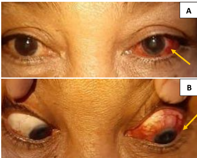
Gambar 2. (A) Dilatasi pembuluh darah konjungtiva dan episklera pada mata kiri (panah kuning) (B) Adanya hambatan pergerakan bola mata kiri ke arah inferolateral (panah kuning).