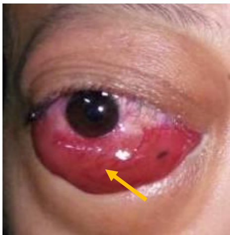
Gambar 3. Kemosis konjungtiva dan gambaran corkscrew akibat dilatasi pembuluh darah (panah kuning).

intrakavernosa, atau akibat fistula. Dari ketiga saraf yang menginervasi otot – otot ekstraokular, saraf abduksen, merupakan saraf yang paling sering terkena dampak dari fistula karotis-kavernosa karena letaknya yang berada di medial sinus kavernosus dan dekat dengan arteri karotis interna, sedangkan saraf okulomotor dan troklear yang berada di dinding lateral sinus relatif lebih aman dan jarang terkena dampak langsung. Adanya pembesaran dan pembengkakan otot – otot ekstraokular juga berperan terhadap timbulnya oftalmoplegia. Derajat oftalmoplegia pada kasus fistula