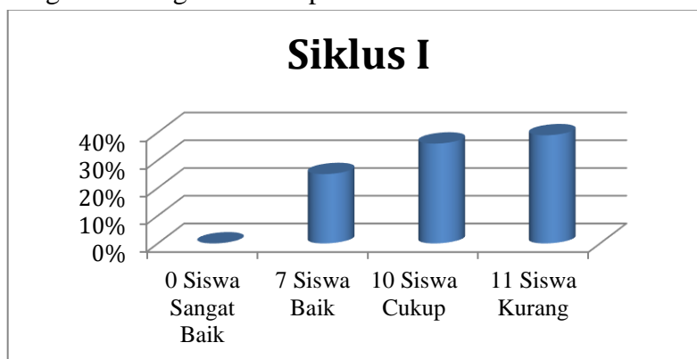
Gambar 2: Diagram batang skor nilai persentase pada siklus I

Berdasarkan tabel 2. Tampak dari 28 subjek penelitian, terdapat 0 siswa yang memiliki kategori sangat baik (0 %), 7 siswa dalam kategori baik (25 %), 10 siswa yang memiliki dalam kategori cukup (35,71 %), dan 11 siswa memiliki kategori kurang (39,29 %). Kemampuan menggiring bola dalam permainan sepakbola melalui metode inkuiry pada siklus I dapat dilihat pada diagram batang skor nilai persentase berikut ini :