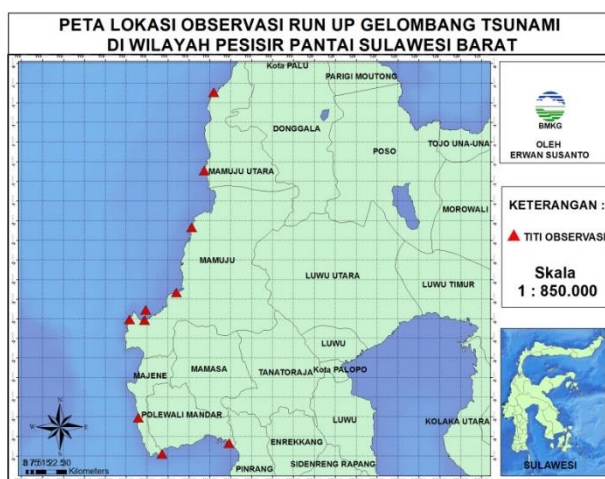
Gambar 2. Lokasi penelitian

Lokasi penelitian berada di pesisir Pantai Sulawesi Barat yang berada. Segitiga merah pada Gambar 2 adalah lokasi observasi run – up tsunami. Titik observasi di sepanjang pesisir Pantai Sulawesi Barat terdiri dari 10 titik observasi yang penentuannya berdasarkan pada daerah yang strategis seperti tempat wisata dan pelabuhan.