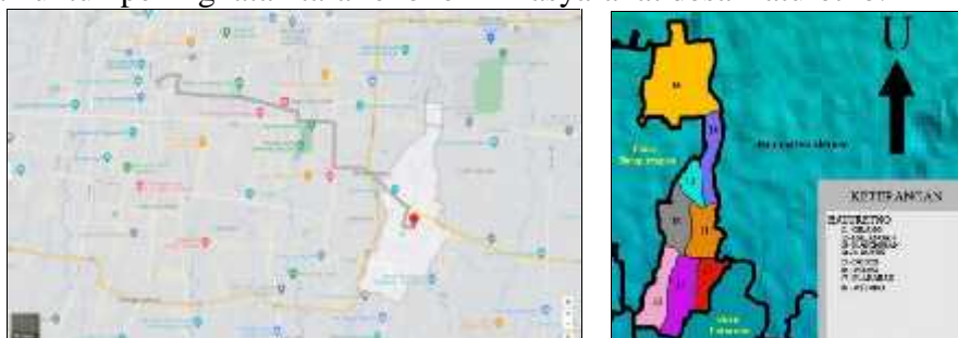
Gambar 1. Lokasi Desa Baturetno

Terdapat banyak tantangan yang dialami desa dalam upaya mengoptimalkan potensi yang dimiliki. Mayoritas desa masih berkebutuhan dalam permasalahan kemiskinan, keterpurukan gizi, ketertinggalan ekonomi dan informasi, serta terjadinya diskriminasi terkait pertumbuhan dan perkembangan masyarakat pedesaan. Dewi (2010) menyatakan bahwa pertumbuhan masyarakat pedesaan erat kaitannya dengan peningkatan ekonomi. Desa merupakan penyelenggaraan pemerintahan level paling bawah yang dituntut melakukan pemberdayaan ekonomi untuk kesejahteraan warganya. Sejak disahkan Undang-Undang Nomor 6 tahun 2014, desa memiliki kewenangan pengelolaan baik internal maupun eksternal. Regulasi tersebut menjadi momentum dalam mendorong terciptanya tata kelola desa yang transparan, akuntabel, mendorong lebih banyak keterlibatan masyarakat dalam pengelolaan desa sebagai upaya meningkatkan perekonomian desa yang dapat menghidupi warganya (Rahmawati, 2020). Begitu juga di Desa Baturetno, Kecamatan Banguntapan, Kabupaten Bantul, Daerah Istimewa Yogyakarta. Pengelolaan desa telah dilakukan dengan profesional dengan harapan agar setiap hal yang berkaitan dengan pengelolaan kepentingan warga dapat ditangani dengan baik. Desa Baturetno terletak di sisi timur kota Yogyakarta (30 menit dari pusat kota) dan memiliki berbagai potensi geografis maupun humanis yang dapat dimanfaatkan untuk peningkatan taraf ekonomi masyarakat desa Baturetno.