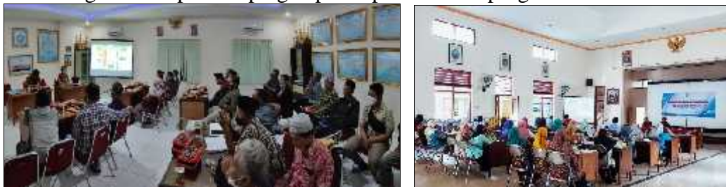
Gambar 7. Kegiatan Penyuluhan di Desa Baturetno

Penyuluhan penggunaan teknologi juga dilaksanakan dalam program ini karena mayoritas warga desa Baturetno telah menggunakan smartphone dalam kehidupan sehari-hari. Fungsi-fungsi yang belum dimanfaatkan di smartphone seperti mengedit foto, cara merekam video, mengirim email melalui handphone dan berbagai pemanfaatan lain diajarkan dalam kegiatan tersebut. Tujuannya agar peserta kegiatan dapat memaksimalkan peralatan smartphone -nya untuk mendukung kegiatan wirausaha dan mendukung transformasi digital. Di setiap kegiatan penyuluhan diberikan pre-test sebelum kegiatan dimulai dan post-test setelah kegiatan berakhir. Hal ini digunakan untuk mengetahui progres penambahan wawasan dan pengetahuan dari peserta. Dari hasil post-test setelah kegiatan penyuluhan akan digunakan sebagai bahan pendampingan paska pelaksanaan program.