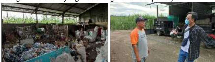
Gambar 6. Observasi di Unit Usaha Pengelolaan Sampah KSM Sejahtera Mandiri

dihasilkan oleh tiap keluarga akan diambil oleh petugas setiap hari mulai sehabis subuh sampai sekitar jam 10.00 WIB. Petugas mengambil sampah dari rumah ke rumah dengan menggunakan kendaraan roda tiga dengan bak terbuka. Lalu sampah rumah tangga dikumpulkan ke lokasi pengelolaan, dipisahkan tiap jenis sampah dari organik dan plastik, yang bisa di daur ulang dan tidak. Unit usaha KSM Sejahtera Mandiri ini juga mulai membudidayakan ‘ maggot ’ yang saat ini mulai banyak dternakkan. Hasil wawancara dengan pengelola KSM Sejahtera Mandiri didapatkan data dan informasi bahwa budidaya ternak ‘ maggot ’ ini dapat menghasilkan keuntungan tinggi dikarenakan permintaan pasar yang meningkat dari waktu ke waktu. Cara ternaknya juga didapat dari beberapa kali mendapatkan pelatihan yang dilaksanakan baik oleh dinas terkait maupun lembaga non pemerintah yang berkaitan. Permasalahan utama yang disampaikan oleh pengelola KSM Sejahtera Mandiri adalah terkait tata kelola usaha serta pencatatan keuangan yang masih sederhana sehingga berpotensi terjadinya kebocoran dan kecurangan sehingga diperlukan adanya suatu sistem pencatatan keuangan unit usaha yang mudah digunakan dan powerful .