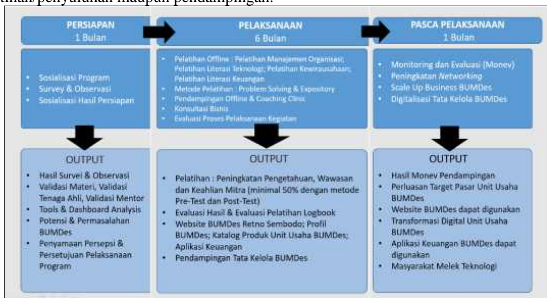
Gambar 4. Metode Pelaksanaan Kegiatan Pengabdian Masyarakat

Metode yang digunakan dalam pelatihan di program pengabdian ini antara lain partisipatif, demonstrasi/penyuluhan, praktek/ workshop untuk mempermudah pencapaian tujuan pengabdian (Satrya et al., 2019) dan pendampingan. Selain itu, terdapat metode secara keseluruhan yang hampir sama, yaitu 1) Pembangunan komunitas masyarakat yang kreatif dan inovatif, 2) Persuasi atau ajakan kepada masyarakat, 3) Pemberdayaan dan pelatihan kepada masyarakat, 4) Sinergitas masyarakat, dan 5) Potensi dan budaya lokal. Tahapan pelaksanaan pengabdian masyarakat dibagi dalam 3 tahap, yaitu tahap pra-pelaksanaan, tahap pelaksanaan dan tahap paska-pelaksanaan. Mayoritas pelaksanaan kegiatan pengabdian masyarakat ini dilaksanakan secara luring (tatap muka) baik pada saat pemberian pelatihan/penyuluhan maupun pendampingan.