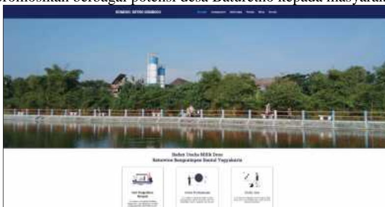
Gambar 9. Tampilan Website BUMDes Retno Sembodo

Luaran dalam bentuk produk yang dihasilkan dari program pengabdian masyarakat ini salah satunya adalah website BUMDes Retno Sembodo yang bisa diakses melalui link https://retnosembodo.id/ . Website ini digunakan sebagai media informasi yang dapat diakses oleh masyarakat umum dan di dalamnya berisi profil, produk unit usaha dan kontak dari BUMDes. Dengan penggunaan website ini dapat dimanfaatkan untuk memperluas pangsa pasar produk-produk yang dihasilkan oleh unit usaha BUMDes maupun dari warga desa Baturetno. Website ini juga dapat menjadi sarana branding bagi BUMDes Retno Sembodo sekaligus mempromosikan berbagai potensi desa Baturetno kepada masyarakat luas.