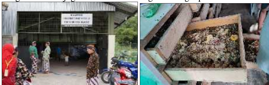
Gambar 2. Unit Usaha BUMDes Pengelolaan Sampah KSM Sejahtera Mandiri

Peran BUMDes diharapkan menjadi salah satu sumber pemasukan desa yang dapat digunakan untuk meningkatkan perekonomian masyarakat (Rahayuningsih et al., 2019). Keberadaan BUMDes dapat membawa perubahan signifikan bagi peningkatan kesejahteraan