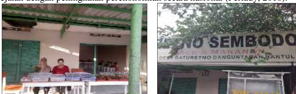
Gambar 3. Unit Usaha BUMDes Katering dan Makanan

Ditinjau sejak awal pembentukannya, BUMDes Retno Sembodo masih tergolong muda sehingga tata kelolanya masih banyak yang perlu dibenahi dan ditingkatkan agar lebih profesional. Beberapa permasalahan tata kelola di BUMDes Retno Sembodo diantaranya 1) Pencatatan laporan keuangan BUMDes masih bersifat manual/tradisional; 2) Pengelolaan BUMDes belum profesional dan tidak kompeten; 3) Masyarakat masih menganggap BUMDes Retno Sembodo hanya milik golongan tertentu; dan 4) Sistem pengelolaan