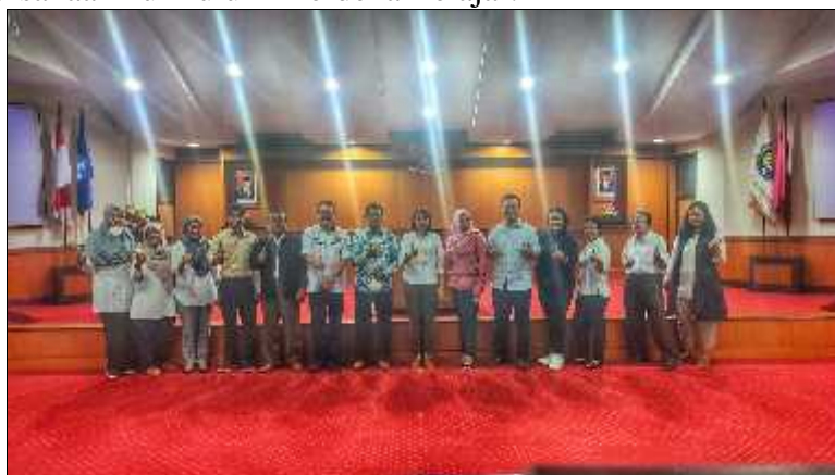
Gambar 8. Diskusi Output Mata Kuliah MBKM dengan Program Studi

Program pengabdian masyarakat ini merupakan pelaksanaan dari Program Riset Keilmuan tahun 2021 yang diadakan oleh Kementerian Pendidikan, Kebudayaan, Riset dan Teknologi dengan skema Hibah Riset Desa. Target capaian dari pelaksanaan kegiatan pengabdian masyarakat ini salah satunya adalah Model Rancangan Mata Kuliah Merdeka Belajar yang dapat diaplikasikan dalam pembelajaran akademik. Dasar yang diambil dalam merancang mata kuliah adalah dari pelaksanaan program pengabdian ini dengan disesuaikan Capaian Pembelajaran Program Studi. Metode ini tentunya masih memerlukan banyak perbaikan dikarenakan baru pertama kali dilaksanakan. Namun hal tersebut tidak mengurangi semangat tim pengabdian masyarakat untuk memaksimalkan program dalam upaya untuk mendukung pelaksanaan kurikulum Merdeka Belajar.