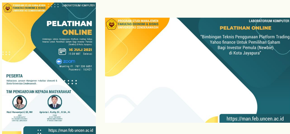
Gambar 1. Flyer dan Background Zoom

Berdasarkan hasil pengabdian bimbingan teknis penggunaan platform trading yahoo finance untuk pemilihan saham bagi investor pemula ( newbie ) di Kota Jayapura diperoleh bahwa mayoritas dari peserta bimbingan teknis merupakan calon investor dan belum pernah mendengar serta mempergunakan fitur-fitur platform yahoo finance untuk menganalisis saham-saham perusahaan. Kegiatan pengabdian ini dilakukan secara daring menggunakan aplikasi zoom dengan memberikan pemberitahuan dalam bentuk flyer kepada sasaran kegiatan.