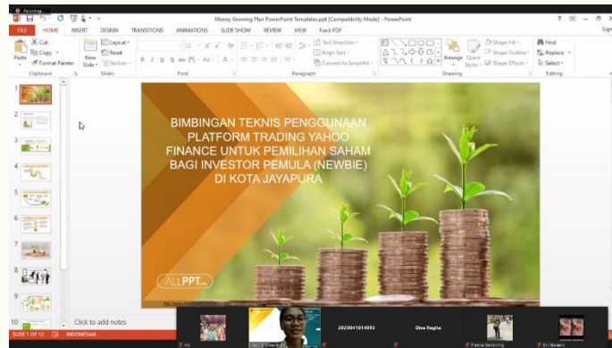
Gambar 2. Pembukaan PKM

Pada proses pengabdian terjadi dialog dua arah antara yang cukup aktif dimana salah satu peserta bimbingan teknis merupakan investor muda ( newbie ) tetapi belum pernah mendengar dan menggunakan platform yahoo finance . Dalam pemilihan saham yang dilakukan oleh newbie yaitu dengan mendengar saran yang diberikan oleh broker dari perusahaan sekuritas sehingga saham yang dimiliki merupakan saham yang bagus tetapi cukup mahal untuk mahasiswa dan pada awal mengenal saham, dalam pemilihannya hanya mengikuti para influencer tanpa melakukan analisis pribadi terlebih dahulu.