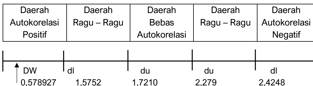
Gambar 3. Uji Durbin Watson

Berdasarkan hasil analisis regresi diperoleh nilai Durbin Watson sebesar 0,578927 Sedangkan besarnya tabel DW dengan k=3 dan n=85 maka diperoleh nilai du (batas dalam) = 1,7210 dan dl (batas luar) = 1,5752 ; 4-du = 2,279 dan 4-dl = 2,4248 . Untuk lebih jelas, maka dapat dilihat pada gambar 4.3 sebagai berikut: