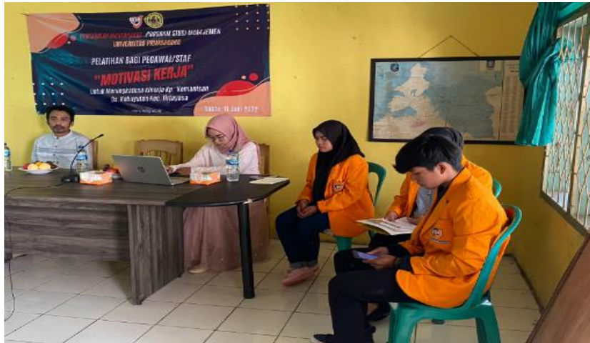
Gambar 1.2 Pendampingan Peserta Melibatkan Mahasiswa