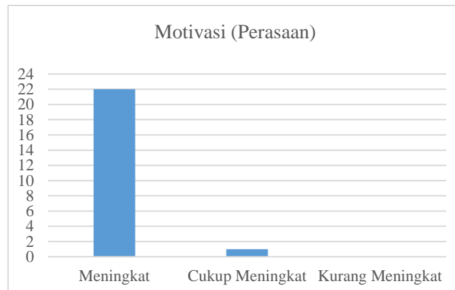
Grafik 1.2 Tabel Pemahaman Peserta

Dari hasil rekapitulasi pemahaman peserta dari 23 peserta yang hadir saat pelatihan, terdapat 20 orang mengerti tentang materi pelatihan yang disampaikan dan terdapat 3 orang peserta yang cukup mengerti materi yang telah disampaikan. Hal ini menunjukkan materi yang disampaikan telah dipahami oleh peserta saat pelatihan berlangsung.