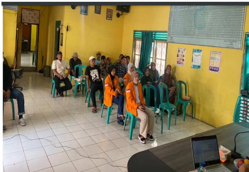
Gambar 1.1 Pemberian materi Motivasi kerja

Dari hasil rekapitulasi pemahaman peserta dari 23 peserta yang hadir saat pelatihan, terdapat 20 orang menyatakan suka dan termotivasi dengan materi yang disampaikan, sehingga dapat meningkatkan motivasi kerja para pegawainya dan 2 orang peserta cukup meningkat pengetahuan tentang motivasi kerja.