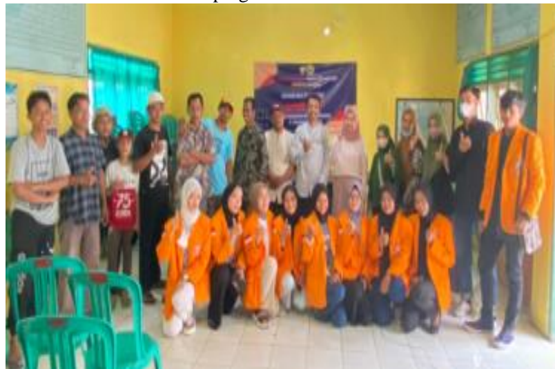
Gambar 1.3 Penutupan acara melibatkan Staff desa dan mahasiswa

Terdapat beberapa tahapan penyuluhan pada program pengabdian masyarakat ini yaitu: