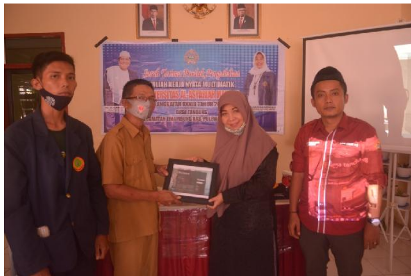
Gambar 1. Penyerahan Produk Pengabdian Masyarakat Oleh Rektor Universitas Al Asyariah Mandar ke Pemerintah Desa Tandung