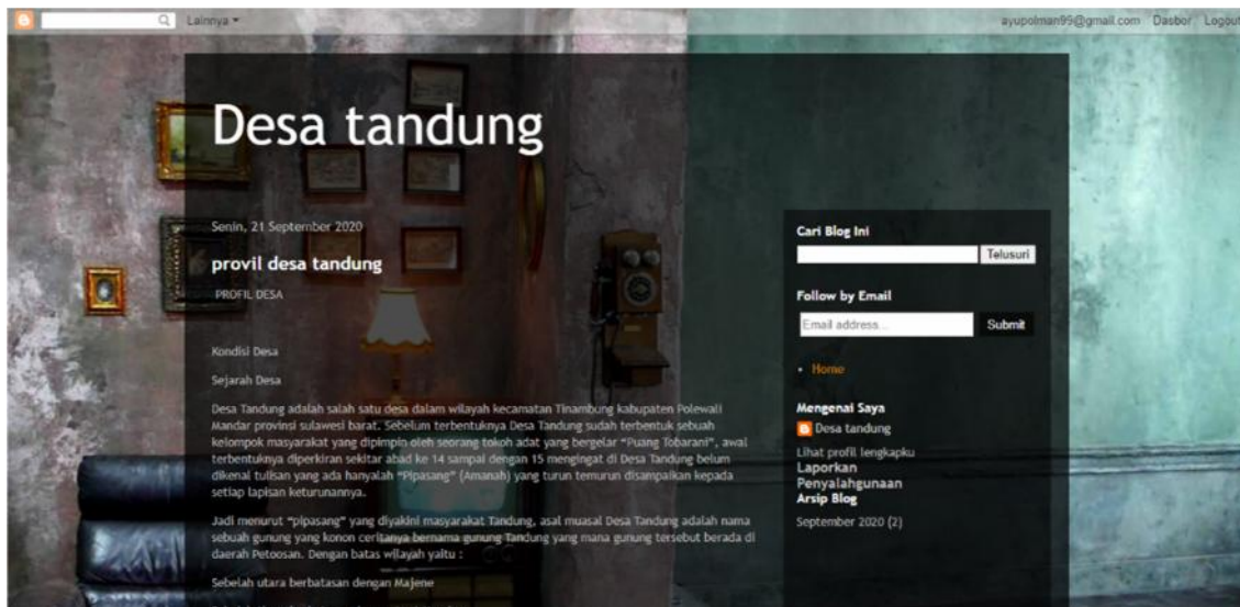
Gambar 2. Tampilan Profil Desa Tandung

Saat ini banyak instansi pemerintah pusat dan pemerintah daerah mengembangkan pelayanan publik melalui Teknologi komunikasi dan informasi (TIK/ICT) yang disebut dengan e-government (Edwi Arief Sosiawan, 2008). Adapun kendala dan hambatan yang dihadapi pada saat proses pembuatan produk pengabdian desa adalah sebagai berikut terbatasnya informasi atau data yang didapat dari pihak mitra dan infrastruktur jaringan yang belum memadai sehingga pengaksesan pada website desa menjadi terhambat.