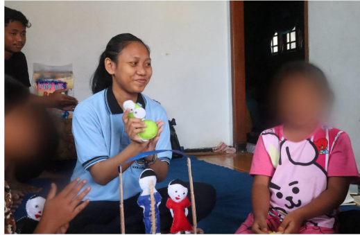
Gambar 7. Perwakilan siswa maju untuk bercerita