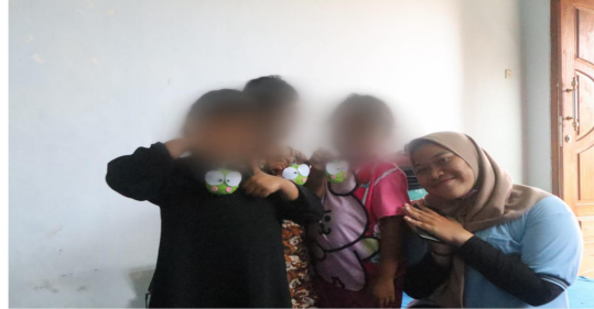
Gambar 8. Pemberian hadiah gantungan kunci