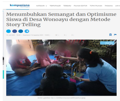
Gambar 8. Pemberitaan Media Massa di Kompasiana

https://www.kompasiana.com/kkndesawonoayu2021/60f52df906310e0f185bb993/menumbuhkan-semangat-dan-optimisme-siswa-di-desa-wonoayu-dengan-metode-story-telling