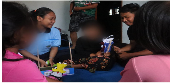
Gambar 4. Memberi solusi kepada siswa

Tahapan keenam adalah memberi storytelling . Storytelling berisi tentang cerita seorang individu yang mampu mengontrol pikiran serta emosinya kearah positif ketika dihadapkan di situasi yang buruk. Hal ini dapat dilaksanakan agar pelajar dapat termotivasi dengan contoh cerita yang diceritakan dan mampu melakukannya di kehidupan sehari-hari mereka. Tahapan ketujuh adalah memberi tugas pada siswa-siswi. Tugas yang diberikan yaitu membuat cerita atau membuat poin-poin tentang hal-hal yang membuat mereka bahagia atau pengalaman lucu mereka agar mereka yang akhir-akhir ini merasa sedih, marah atau kecewa terhadap orang-orang sekitar dapat melupakannya. Tahapan keenam dan ketujuh mampu diketahui pada Gambar 5 dan 6.