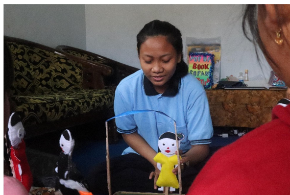
Gambar 1. Penerapan alat peraga boneka flanel dan panggung boneka.

Kata kunci: glad game, permainan, storytelling