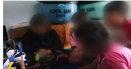
Gambar 6. Memberi tugas pada siswa-siswi

Tahapan kedelapan adalah perwakilan siswa-siswi maju untuk menceritakan. Setelah tugas yang telah diberikan oleh pengajar selesai dikerjakan, siswa-siswi yang mau, tidak malu, dan tidak gugup dapat maju kedepan kelas untuk menceritakan pengalaman mereka yang membahagiakan. Hal ini bertujuan untuk menularkan energi positif kepada siswa-siswi lainnya. Terakhir, tahapan kesembilan adalah membagikan kuesioner setelah proses belajar mengajar. Kuesioner secara umum dapat berisi tentang bagaimana perasaan siswa-siswi atau pelajar setelah mendengar storytelling dari pengajar dan cerita dari teman-temannya di kelas. Opsi jawaban ada 2 yaitu Iya dan Tidak. Kuesioner ini dibuat dengan tujuan untuk mengetahui perkembangan emosi siswa-siswi ketika selesai proses belajar mengajar. Untuk tahapan kedelapan dapat dilihat dalam Gambar 7 dan 8.