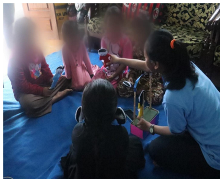
Gambar 2. Memperkenalkan Glad Game

Tahapan ketiga adalah memperkenalkan Glad Game kepada siswa-siswi kelas 5 SD. Setelah kuesioner diisi, maka proses belajar mengajar dimulai. Lalu, pengajar dapat memperkenalkan materi yang akan dia ajarkan di dalam kelas pembelajaran ini. Materi yang dimaksud ini adalah materi tentang Glad Game. Hal ini mampu diketahui pada Gambar 2.