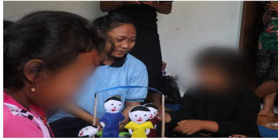
Gambar 3. Tanya jawab antara pengajar dengan siswa