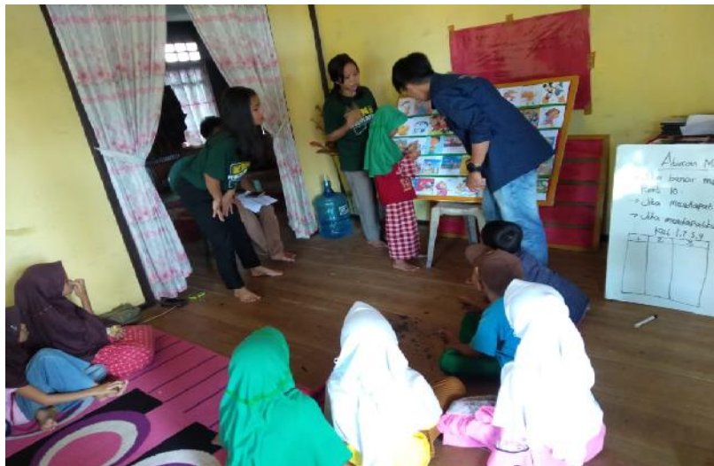
Gambar 4. Pendampingan Penggunaan Pabel games

Selain itu, produk pengabdian yang dihasilkan dari Prodi Matematika adalah pabel games. Pabel games adalah papan belajar bermain yang terdiri dari papan alas dan kartu bermain yang dilengkapi dengan soal serta dadu untuk digunakan dalam permainan. Alat peraga pabel games dapat digunakan untuk semua mata pelajaran di MI dan semua tingkatan kelas. Pembelajaran dengan menggunakan pabel games bertujuan untuk memotivasi peserta didik dalam menerima pembelajaran dan menumbuhkan antusias peserta didik dalam menerima materi pembelajaran serta meningkatkan prestasi prestasi. Kegiatan pengabdian dilakukan dengan metode pelatihan dan pendampingan. Berdasarkan hasil pelatihan dan pendampingan terhadap 14 orang guru MI DDI Passembarang diperoleh: (1)100% guru terampil menggunakan alat peraga pabel games, (2) 100% guru pertama kali menggunakan alat peraga pabel games, (3) 100% guru merespon positif alat peraga pabel games, dan (4) 100% guru dimudahkan dalam menyampaikan materi dengan menggunakan lat peraga pabel games.