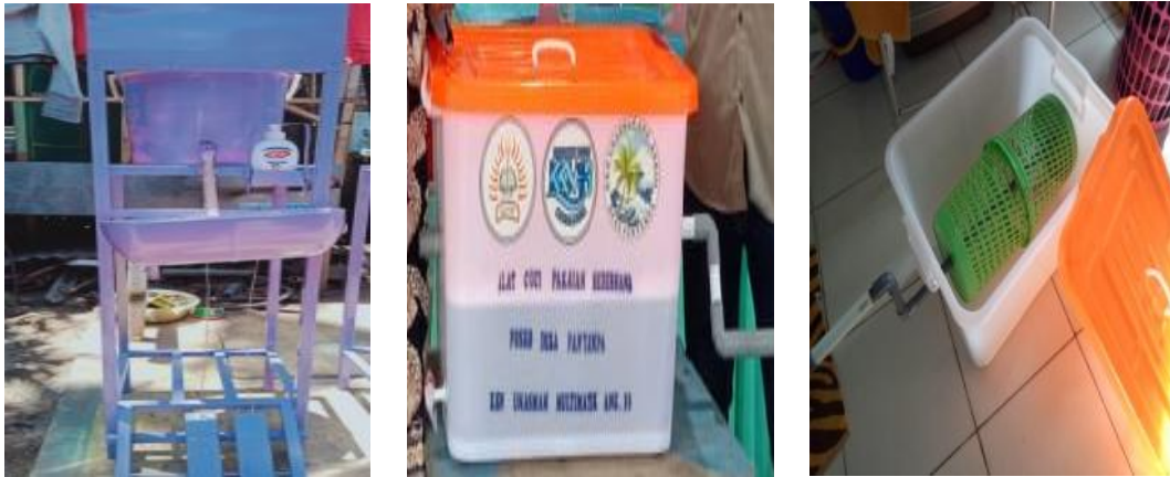
Gambar 3. Washing Machine Portable dan Westafel cuci tangan tanpa sentuh sebagai Produk Pengabdian Kepada Masyarakat

terwujud dan westafel cuci tangan tanpa sentuh, sehingga mahasiswa juga memberdayakan jasa sebagian kelompok masyarakat setempat.