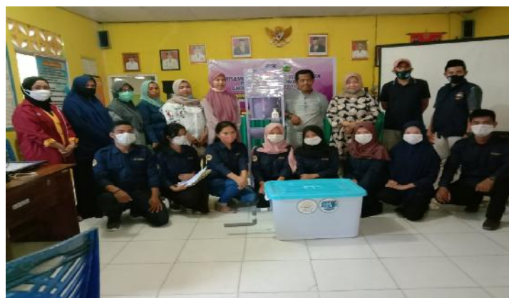
Gambar 1. Penyerahan Produk Pengabdian Masyarakat Oleh Rektor Universitas Al Asyariah Mandar ke Pemerintah Desa

Kata kunci: KKN Multimatik; Produk Pengabdian; Pandemi Covid-19