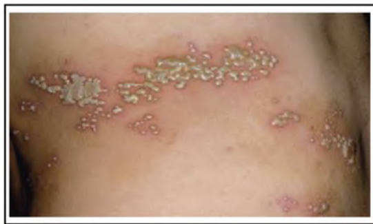
Gambar 2. Manifestasi ruam herpes zoster . Vesikel berkelompok dengan dasar eritem 5

Gejala prodromal tidak umum pada pasien dengan immunocompromised yang berusia di bawah 30 tahun, namun mayoritas terjadi pada penderita yang berusia >60 tahun. Nyeri dan parestesia dapat mendahului ruam HZ dari hari pertama sampai hari ketiga, seminggu, atau lebih lama. 9 Nyeri dan parestesia menjadi salah satu manifestasi klinis dari zoster tanpa kelainan kulit ( zoster sine herpette ) atau neuralgia segmental akut tanpa diikuti erupsi kulit. Rasa tidak nyaman seperti sensasi terbakar, menusuk, kulit menjadi lebih peka, gatal yang tidak tertahankan, dengan intensitas yang bervariasi dapat terasa superfisial sampai dalam. 12 Nyeri dapat terasa terus menerus maupun hilang timbul, dan dapat disertai dengan kekakuan atau hiperestesia dari dermatom kulit yang terkena. 9 Pada pasien dapat terjadi pembesaran kelenjar getah bening pada area yang terkena. 4 Karakteristik HZ yaitu predileksi dapat mengenai bagian tubuh manapun, paling banyak terutama pada daerah torakal, servikal, dan oftalmika. 4 Distribusi ruam pada HZ bersifat unilateral dan terbatas pada kulit yang dipersarafi ganglion sensorik tunggal serta tidak melewati garis tengah tubuh. Lesi kulit yang tampak dapat berupa vesikel berkelompok dengan dasar eritem ( Gambar 2 ). 5