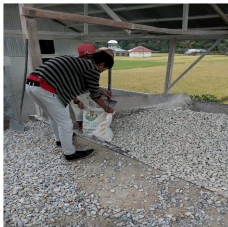
Gambar 1. Pecahan batu dolomit

Bahan yang digunakan dalam penelitian ini adalah sebagai berikut: 1) Semen PCC produksi PT. Semen Padang, 2) agregat kasar berupa batu dolomit ukuran 1 – 2 cm yang berasal dari perbukitan Sumatera Barat terletak di daerah Jorong Durian Kamang Mudiak, Kecamatan Kamang Magek, Kota Bukittinggi yang diproduksi oleh PT. Bakapindo, seperti terlihat pada Gambar 1, batu pecah ukuran 1 -2 cm yang berasal dari PT. ATR, kerikil dan agregat halus berupa pasir yang berasal dari sungai Lubuk Minturun Kota Padang, dengan hasil pengujian sifat fisik seperti terlihat dalam Tabel 1.