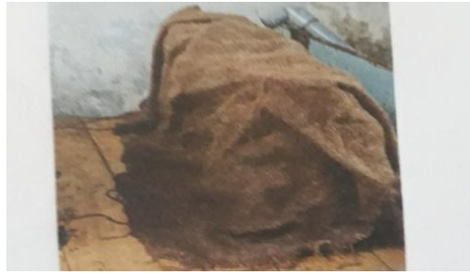
Gambar 4. Perawatan Beton Metode Membungkus dengan Karung Goni Basah