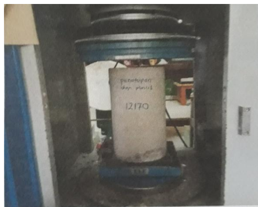
Gambar 5. Pengujian Kuat Tekan Benda Uji Beton

Dengan f_c' adalah kuat tekan benda uji beton dalam N/mm^2 (MPa), P adalah beban maksimum yang mampu tahan oleh benda uji pada waktu pengujian dalam Newton (N), dan A adalah luas penampang melintang silinder dalam mm^2 .