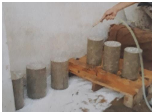
Gambar 2. Perawatan Beton Metode Membasahi Permukaan dengan Air