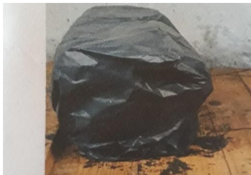
Gambar 3. Perawatan Beton Metode Membungkus dengan Plastik Hitam