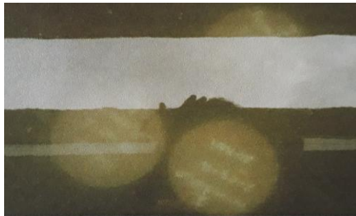
Gambar 1. Perawatan Beton Metode Merendam Dalam Air