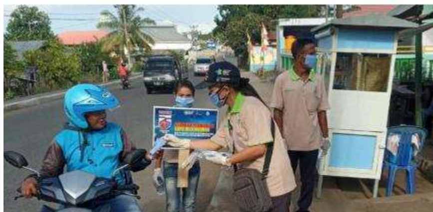
Gambar 3. Kegiatan Pembagian Masker

Masker kain yang dibagikan bisa digunakan sebagai pengganti masker medis untuk mengurangi risiko penularan COVID 19 di tengah masyarakat umum. Banyaknya kasus orang tanpa gejala (OTG) juga mendasari sosialisasi masker kain. Orang yang tidak sadar bahwa dirinya positif Corona bisa saja menuliri orang lain tanpa sengaja ketika berinteraksi tanpa masker. Satu tetesan (droplet) cairan saja bisa menyebabkan orang lain terkena COVID 19. Untuk mengantisipasi kejadian itu, masyarakat dihimbau mengenakan masker ke mana pun pergi di area publik. Namun, manfaat masker kain tersebut bisa didapatkan selama memenuhi persyaratan untuk mendukung efektivitasnya (Kemenkes, 2020). Pembagian masker telah dilakukan oleh beberapa kalangan, lokasi dan wilayah yang berbeda-beda sejak terjadinya wabah COVID 19. Firdayanti et al. (2020) pada bulan Juni telah membagi masker sekitar 300 di Kelurahan Romang Polong, Kabupaten Gowa. Syapitri et al. (2020) membagi masker sebanyak 500