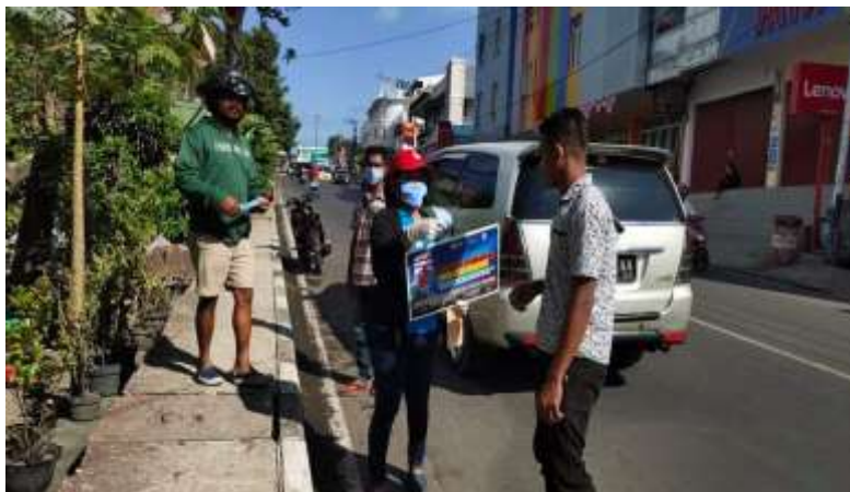
Gambar 3. Kegiatan Edukasi Berbasis Poster

Tingginya penyebaran COVID 19 perlu disikapi dengan pengetahuan yang tepat oleh semua lapisan masyarakat terlebih oleh para pemimpin pemegang kebijakan. Pengetahuan yang salah akan menghasilkan perencanaan dan penanganan yang salah juga sehingga diperlukan edukasi dan dukungan sumberdaya berupa sarana dan prsarana yang memadai terkait dengan pencegahan penularan COVID 19 seperti