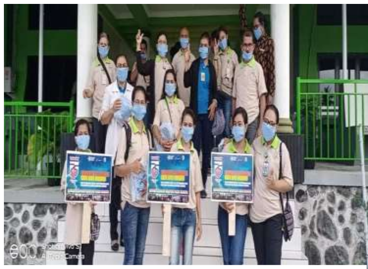
Gambar 2. Persiapan Kegiatan Pengabdian

Pelaksanaan kegiatan pengabdian kepada masyarakat diawali dengan beberapa persiapan. Pertama, tim pengabdian masyarakat melakukan merencanakan kegiatan berupa persiapan sumberdaya yang dibuthkan dalam kegiatan yakni dengan mengidentifikasi kebutuhan program terkait pelaksanaan edukasi pencegahan covid-19 dan pembagian masker seperti mempersiapkan sarana dan prasarana yang mendukung program dan materi edukasi yang diberikan, banner, pamflet, sticker, dan masker. Kedua, tim melakukan observasi dan analisis situasi, mengidentifikasi dan menetapkan masalah yang akan diintervensi berupa kegiatan pengabdian kepada masyarakat. Ketiga, tim melakukan koordinasi dengan tokoh masyarakat dan tim gugus tugas di wilayah setempat untuk persiapan pelaksanaan baik waktu dan tempat pelaksanaan. Keempat, tim pengabdian masyarakat melakukan kegiatan yang dilaksanakan selama 1 hari. Program Studi Keperawatan Ende Politeknik Kesehatan Kemenkes Kupang membagikan 1000 buah masker gratis kepada masyarakat sebagai bentuk dukungan terhadap program nasional pengendalian penyebaran kasus COVID 19. Hal tersebut juga mendukung “Gerakan Pembagian Satu Juta