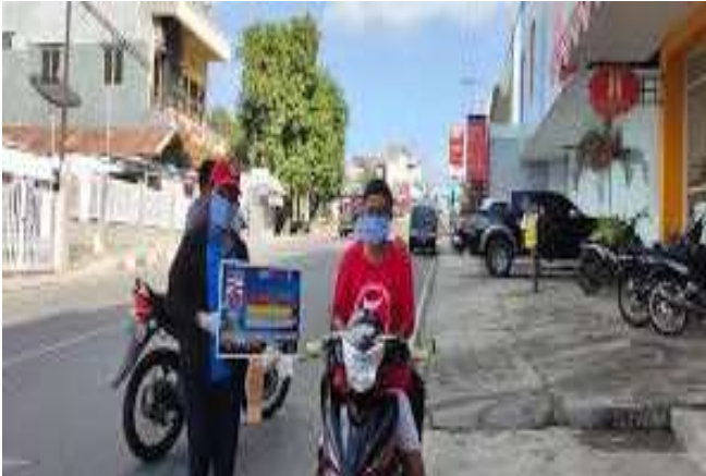
Gambar 4. Kegiatan Edukasi Berbasis Poster

Adaptasi kehidupan baru sudah mewajibkan masyarakat menggunakan masker saat beraktivitas di luar rumah. Namun, kurangnya edukasi dan rasa peduli masyarakat, menjadi tantangan tersendiri dalam proses penegndalian penularan COVID 19. Penomena tersebut juga yang melatar belakangi kegiatan pengabdian kepada masyarakat ini dilakukan secara masif. Pada pelaksanaan kegiatan pengabdian,