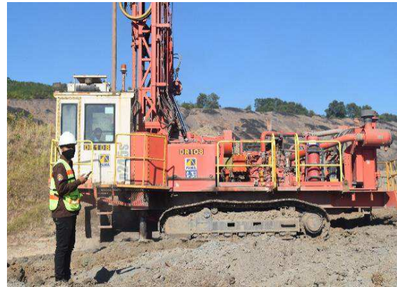
Gambar 3. Alat bor Sandvik D245S