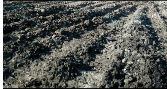
Gambar 3. Material lempung pasir

Material yang dikerjakan dalam kegiatan pemindahan overburden pada Pit 3 Timur Penambangan Banko Barat adalah lempung pasir (Gambar 3). Jenis material ini bersifat lunak dan mudah digali. Semakin mudah material untuk digali, maka produktivitas alat gali-muat dan alat angkut akan semakin meningkat.