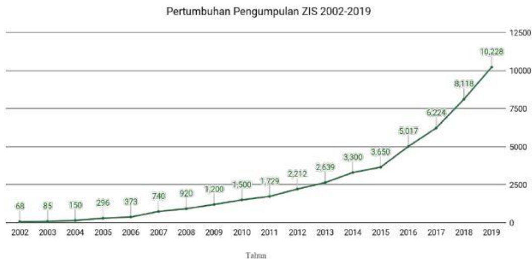
Gambar 1. Data Pertumbuhan Pengumpulan ZIS 2002-2019

Melihat kemiskinan di Indonesia yang tidak kunjung berkurang para penggiat bisnis lembaga kemanusiaan islam mengambil peran sebagai membantu mengurangi kemiskinan di Indonesia. Seperti dengan banyaknya Lembaga Amil Zakat (LAZ) swasta maupun negeri seperti BAZNAS, Dhompot Dhuafa, Rumah Zakat, Inisiatif Zakat Indonesia, LAZISMU dan banyak lagi LAZ yang saling menunjukkan kinerjanya.