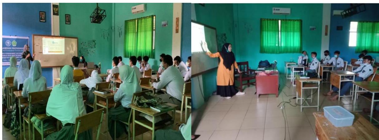
Gambar 2. Pelatihan Wirausaha Digital Marketing

Siswa/I kemudian diberikan tugas eksperimen dalam mengembangkan bisnis digital yang akan mereka bangun. Praktisi akan menilai sejauh mana progress siswa/i tersebut dalam memahami bisnis dengan digital marketing.