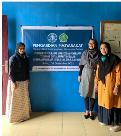
Gambar 3. Tim Pelaksana Pemas