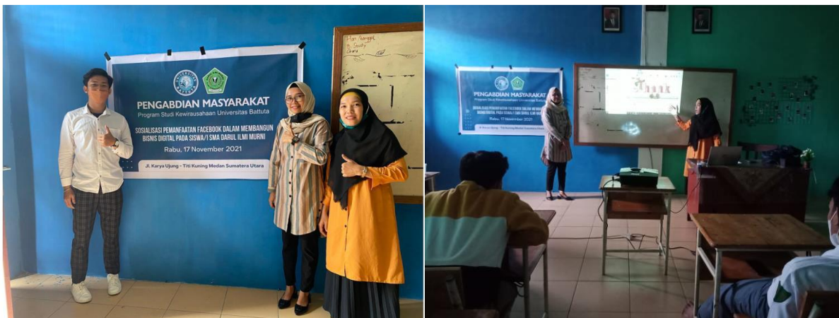
Gambar 2. Pelatihan Bisnis Digital

Siswa/I kemudian diberikan tugas eksperimen dalam mengembangkan bisnis digital yang akan mereka bangun. Praktisi akan menilai sejauh mana progress siswa/i tersebut dalam memahami bisnis digital dengan facebook marketing.