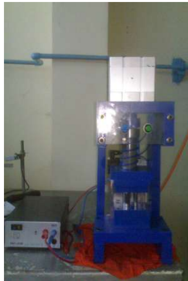
Gambar 3. Alat Press Tool O-Ring