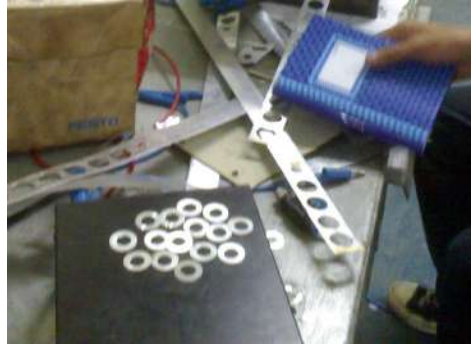
Gambar 4. Hasil Produk O-Ring