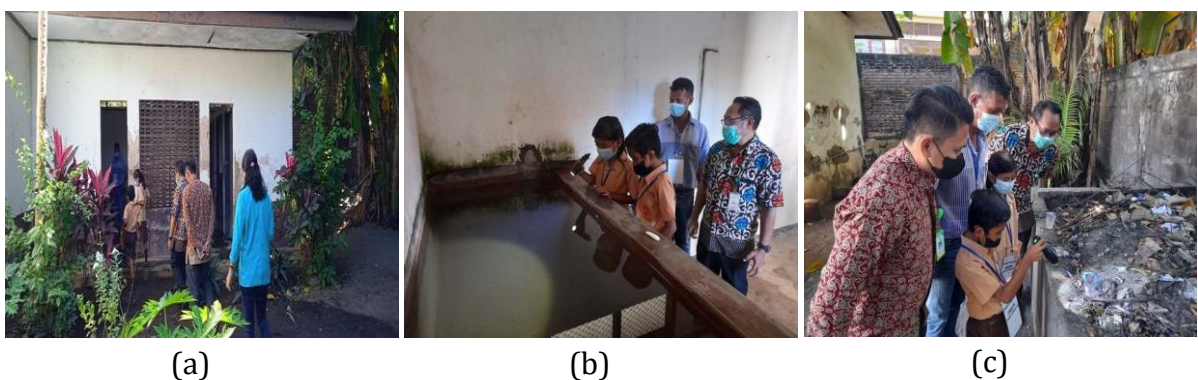
Gambar 3. (a) Pemantauan dan peninjauan jentik nyamuk (b) di kolam air (c) di wadah bekas