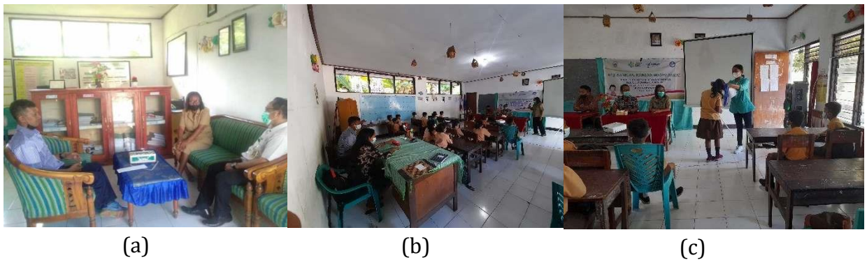
Gambar 1. (a) Konsolidasi dengan pihak sekolah (b) Persiapan pre test (c) Perekrutan calon Jumantik

Dalam kegiatan pengabdian masyarakat ini yang menjadi sasaran adalah siswa/i, guru dan kepala sekolah. Semua sasaran mengikuti kegiatan sampai selesai yaitu 20 orang siswa/i (10 orang siswa/i kelas IV dan 10 orang siswa/i kelas V), didampingi oleh 1 orang guru UKS, 3 orang guru bantu, dan 1 orang kepala sekolah. Pengabdian ini secara dini meningkatkan pengetahuan dan perilaku siswa dalam upaya pencegahan penularan DBD dan mengajarkan praktik cara pemantauan jentik nyamuk kepada siswa SD Inpres Watujara. Hasil yang diperoleh dari kegiatan yang dilakukan dapat dilihat dalam kegiatan yang telah dilakukan oleh Tim Pelaksana sebagai berikut: