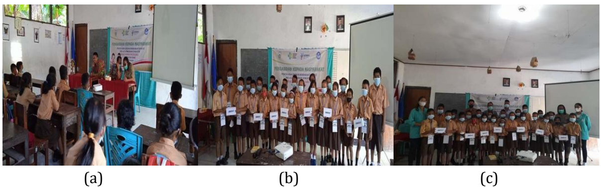
Gambar 2. (a) Penyuluhan dan Edukasi (b) Para peserta Jumantik (c) Guru dan peserta Jumantik