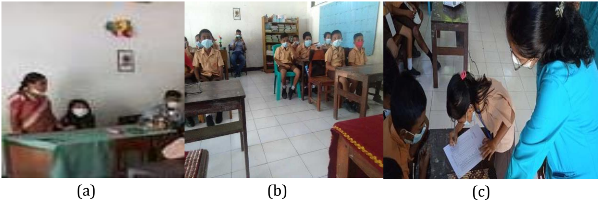
Gambar 4. (a) Pendamping kader Jumantik (b) Pelatihan Jumantik (c) Pencatatan dan pelaporan