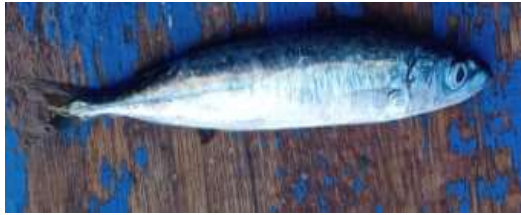
Gambar 2. Ikan layang ( Decapterus russelli )

Jenis hasil tangkapan selama pelaksanaan penelitian adalah jenis ikan pealgis kecil