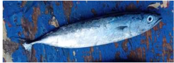
Gambar 3. Ikan tongkol ( Auxis thazard )