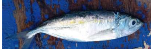
Gambar 4. Ikan selar ( Selaroides spp.)

Penanganan hasil tangkapan merupakan tugas yang harus diselesaikan dengan cepat oleh seluruh anak buah kapal setelah selesai melakukan hauling hasil tangkapan tersebut dinaikan ke atas kapal kemudian dilakukan penyortiran dan penyiraman, setelah itu dimasukkan kedalam bokor atau (baskom) menurut jenis dan ukurannya masing-masing. Penanganan ikan dengan baik akan menentukan mutu dan kualitas ikan tersebut sehingga harga ikan menjadi tinggi. Langkah-langkah yang perlu di ambil dalam melakukan proses penanganan di atas kapal yaitu penyortiran dan pencucian. Setelah ikan di sortir dan dibersihkan maka hasil penyortiran ikan tersebut dimasukkan kedalam bokor atau (baskom) yang tersedia kemudian ikan tersebut dipasarkan ke tempat pelelangan ikan (TPI).