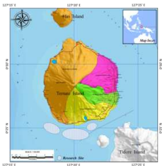
Gambar 1. Daerah Penangkapan

Gambar 1). Penangkapan ikan dengan purse seine dilakukan di perairan Pulau Ternate dan Tidore dengan jarak tempuh ke daerah penangkapan sekitar 20 - 30 menit dan fishing base terletak di Desa Sasa.