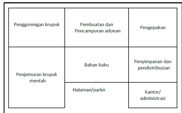
Gambar 2. Tata letak pabrik UMKM X

Pabrik kerupuk UMKM X Bandung Barat, berada diatas tanah seluas sekitar 600 m2, dengan tata letak pabriknya seperti dalam gambar 2 berikut.