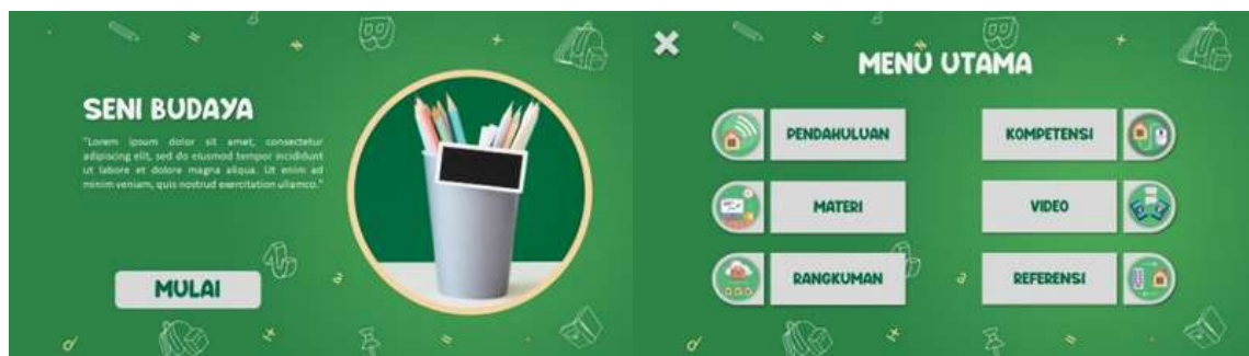
Gambar 2. Media Pembelajaran

Adapun kegiatan pengabdian yang dilakukan oleh tim adalah memberikan pelatihan kepada tenaga pengajar dan staff di MIS AL-HIDAYAH CK akan penggunaan media pembelajaran sebagai sarana mempermudah para tenaga pengajar memberi pembelajaran yang efektif. Sehingga proses belajar mengajar tidak lagi seperti biasanya atau dengan metode konvensional, melainkan bersifat online yang dapat diakses dari komputer ataupun smartphone. Sehingga, dengan memanfaatkan aplikasi Microsoft Power Point, akan memudahkan para guru dalam penyampaian materi ajar serta memudahkan para siswa memahami materi yang diberikan dengan sangat menarik dengan berbagai fitur ataupun simbol-simbol dapat digerakkan. Selanjutnya kegiatan pengabdian kepada masyarakat ini diharapkan dapat mengatasi permasalahan dan juga kendala yang terjadi di MIS AL-HIDAYAH CK. Peserta pelatihan adalah tenaga pengajar dan juga staff di MIS AL-HIDAYAH CK berjumlah 18 orang diantaranya 15 orang tenaga pengajar dan 3 orang staff tata usaha.