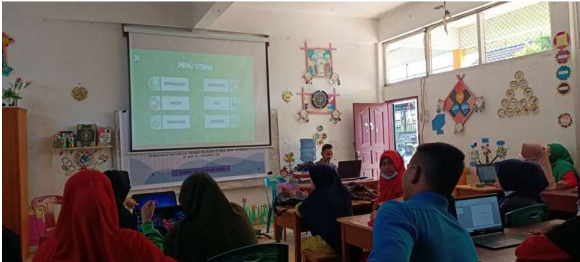
Gambar 3. Proses pelatihan

Pengabdian kepada masyarakat dengan tema pemanfaatan media pembelajaran di era new normal di MIS AL-HIDAYAH CK sebagai sarana terbilang cukup sukses untuk menyalurkan pengetahuan tentang penggunaan media pembelajaran tersebut, dimana seluruh peserta pengabdian kepada masyarakat dapat langsung menggunakan serta mempraktikkan materi yang disampaikan oleh tim, sehingga para peserta mudah memahami cara membuat media pembelajaran yang menarik didalam proses belajar mengajar.