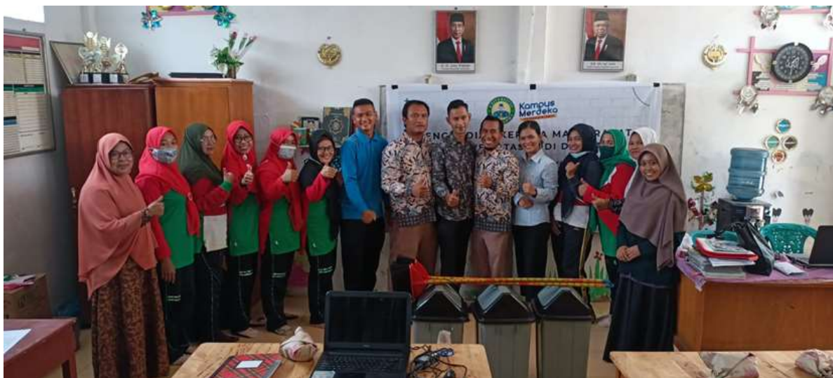
Gambar 4. Foto bersama

Pengabdian kepada masyarakat dengan tema pemanfaatan media pembelajaran di era new normal di MIS AL-HIDAYAH CK sebagai sarana terbilang cukup sukses untuk menyalurkan pengetahuan tentang penggunaan media pembelajaran tersebut, dimana seluruh peserta pengabdian kepada masyarakat dapat langsung menggunakan serta mempraktikkan materi yang disampaikan oleh tim, sehingga para peserta mudah memahami cara membuat media pembelajaran yang menarik didalam proses belajar mengajar.