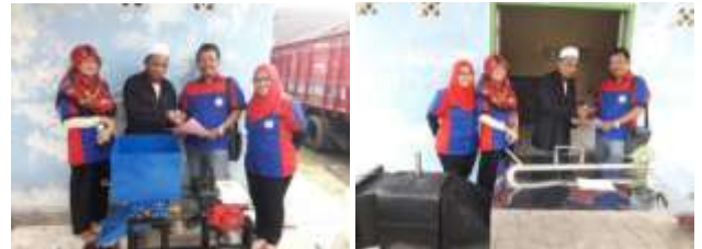
Gambar 4. Penyerahan alat pengupas kopi dan pengering kopi kepada ketua kelompok tani.