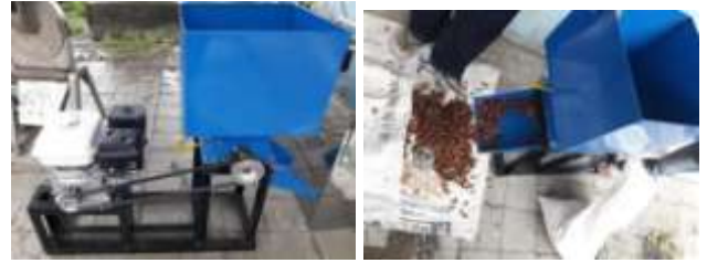
Gambar 2. Alat pengupas kopi.

khususnya anggota kelompok tani benar-benar dapat memanfaatkan alat tersebut sehingga dapat meningkatkan produktivitas dan kualitas kopi masyarakat desa Banyukuning, Kecamatan Bandungan.