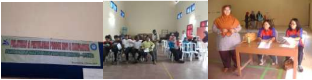
Gambar 1. Sosialisasi manfaat kopi dan cara pengolahan menjadi produk kopi yang baik bagi kesehatan.