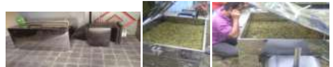
Gambar 3. Alat pengering kopi.