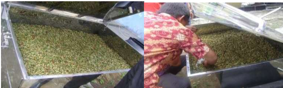
Gambar 5. Anggota kelompok tani mencoba menggunakan alat.