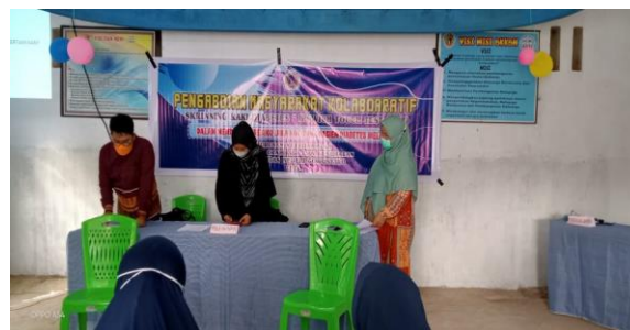
Gambar 2. Persiapan materi pengabdian

Pelayanan Terpadu PKM Kota Selatan Kota Gorontalo.