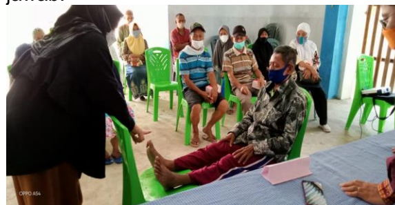
Gambar 3. Demonstrasi pelaksanaan IpTT

Kegiatan yang diawali dengan ceramah dan demonstrasi ini kemudian dilanjutkan dengan latihan. Dari kegiatan tampak bahwa pasien dan keluarga belum mengetahui tentang skrining kaki diabetes dengan metode IpTT. Acara kemudian dilanjutkan dengan sesi tanya jawab, berbagai pertanyaan diajukan secara antusias oleh peserta dalam sesi tanya jawab.