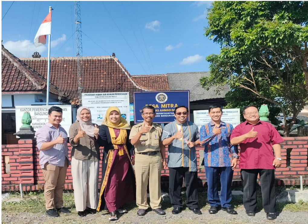
Gambar 2. Tim Pengabdian foto bersama dengan Lurah dan Pimpinan Ranting Muhammadiyah di depan plang desa mitra UAD-Banguncipto yang terpasang di depan balai desa Banguncipto

Kalurahan Banguncipto merupakan salah satu desa binaan Universitas Ahmad Dahlan yang sering digunakan oleh dosen dan mahasiswa untuk pengabdian pada masyarakat (Iin Narwanti, 2018). Selanjutnya Tim Pengabdian melakukan studi pendahuluan, observasi dan wawancara baik kepada Lurah dan Ketua PRM Banguncipto untuk melakukan analisis situasi permasalahan prioritas mitra di lokasi pengabdian. Gambar 2 menunjukkan proses analisis situasi hingga mencapai kesepakatan program kegiatan antara Tim Pengabdian desa mitra.