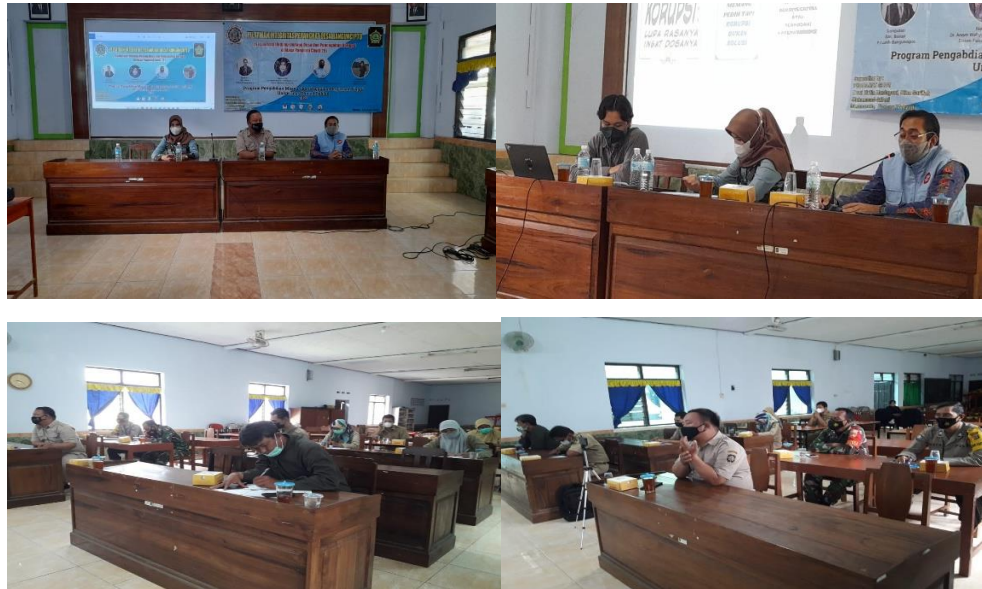
Gambar 4. Pelaksanaan kegiatan

memakan hasil atau barang haram. Gambar 6 menunjukkan proses pelaksanaan pelatihan Perangkat Desa Banguncipto.