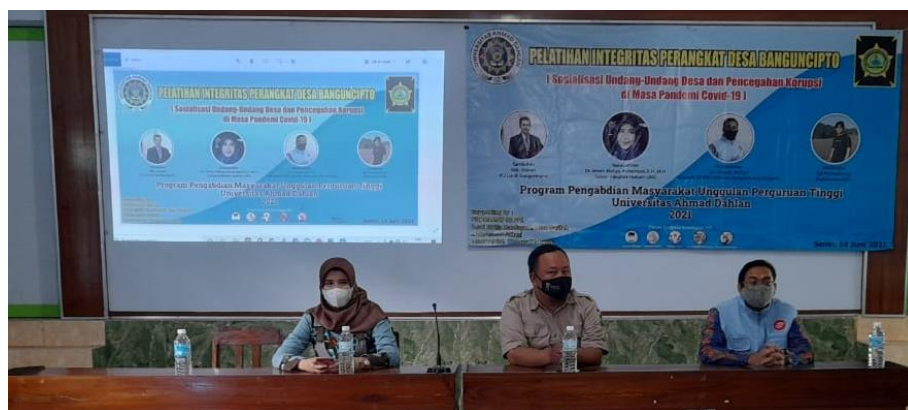
Gambar 5. Penyuluhan Renca aksi

Dalam pelatihan tersebut dilaksanakanlah rencana aksi anti korupsi dengan mengharuskan para peserta dengan menuliskan sebuah kata-kata yang walaupun itu sederhana, akan tetapi dapat menimbulkan kesan yang mendalam dan berarti untuk pemberantasan dimulai dari kesadaran diri terlebih dahulu. Gambar 5 dan 6 menunjukkan rencana aksi yang menjadi aksi nyata para Perangkat Desa Banguncipto dalam pelatihan integritas perihal pilihan lurah yang akan mereka laksanakan.