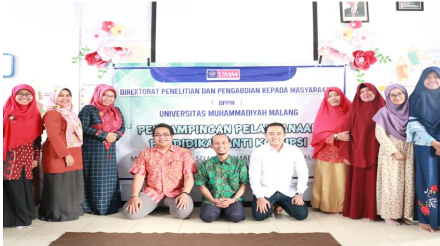
Gambar 4. Pelaksanaan Pengabdian SD Muhammadiyah 8 Malang