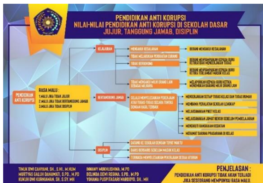
Gambar 5. SOP Pelaksanaan Pendidikan Anti Korupsi