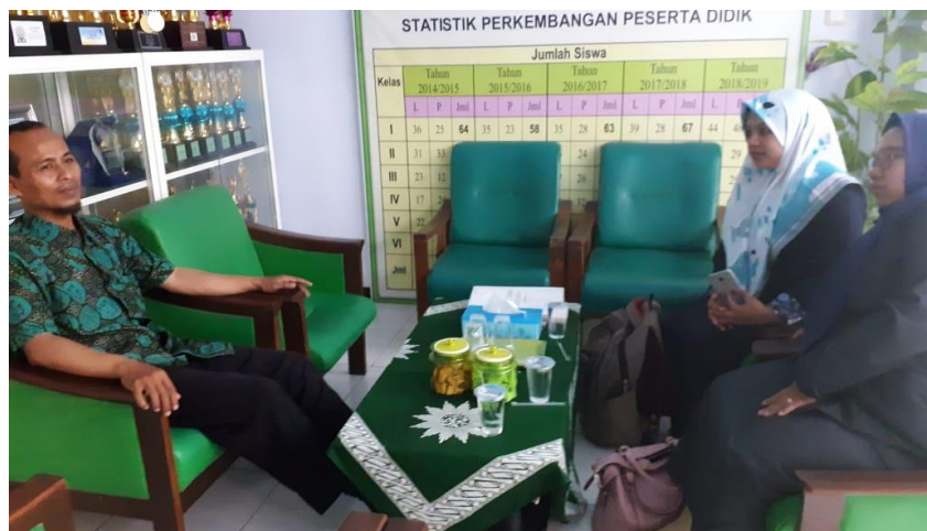
Gambar 2. Pelaksanaan wawancara kepada kepala sekolah SD Muhammadiyah