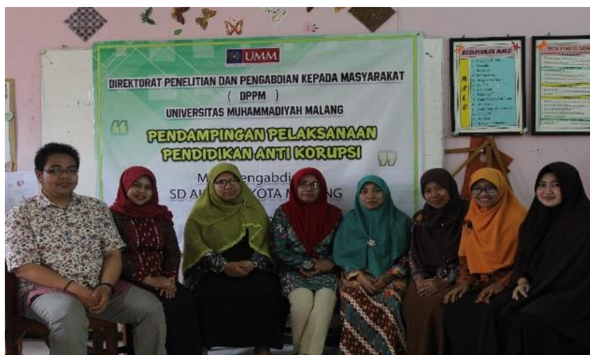
Gambar 3. Pelaksanaan Pengabdian SD 'Aisyiyah Kota Malang

Tahap pelaksanaan pengabdian masyarakat di SD 'Aisyiyah kota Malang dan SD Muhammadiyah 8 Kota Malang dilaksanakan secara terpisah. Hal ini dikarenakan kondisi sekolah dan peserta didik ada beberapa perbedaan. Sehingga pelaksanaan Focus Group Discussion (FGD) dilaksanakan di sekolah masing-masing. Pelaksanaan FGD di SD 'Aisyiyah Kota Malang dihadiri 3 orang guru, yaitu wakil kepala sekolah bidang kesiswaan, dan 2 orang guru. Sedangkan pelaksanaan FDG di SD Muhammadiyah 8 Kota Malang dihadiri 5 orang guru yang terdiri dari kepala sekolah, wakil kepala sekolah bidang kesiswaan, guru wali, dan 2 orang guru lainnya. Pelaksanaan FDG diawali pembukaan oleh MC kemudian dilakukan presentasi dari tim pengabdian tentang pendidikan anti korupsi secara umum, UU Anti Korupsi, dan Pendidikan Anti Korupsi di sekolah. Setelah itu dilanjutkan guru mengutarakan pendidikan Anti Korupsi yang telah dilaksanakan di sekolah. Kemudian dilanjutkan berdiskusi bersama guna mengatasi pendidikan Anti korupsi di sekolah tersebut.