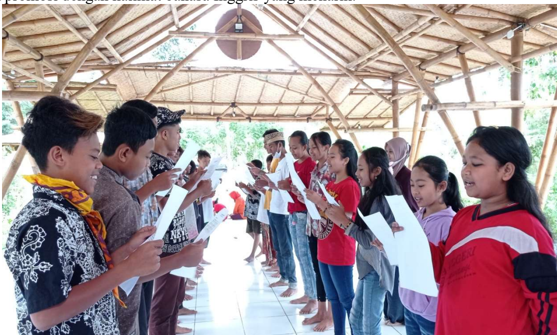
Gambar 2. Drilling Pronunciation & Conversation

Saat pertama kali menyajikan materi, para tutor menggunakan metode ceramah untuk memberi penjelasan ringkas mengenai topik materi yang diajarkan. Setelah penjelasan singkat, tutor membuka sesi tanya jawab dan diskusi dengan peserta. Berbagai metode kami gunakan dan kombinasikan dalam pelatihan ini, misalnya metode drilling untuk mengulang – ngulang pengucapan kosa kata, istilah, hingga kalimat pada dialog agar peserta tidak kaku dan lebih familiar mengucapkan kosakata bahasa Inggris. Setelah latihan/drill berulang kali maka peserta dibagi dalam kelompok – kelompok kecil yang masing – masing didampingi oleh tutor untuk mempraktikkan percakapan yang diajarkan. Pembelajaran juga diselingi game yang menarik agar peserta tidak bosan. Field trip juga dilakukan sekaligus praktik demonstrasi mempromosikan daerah atau produk Kampung halaman. Di materi terakhir peserta diajari bagaimana membuat flyer untuk promosi dengan kalimat bahasa Inggris yang menarik.