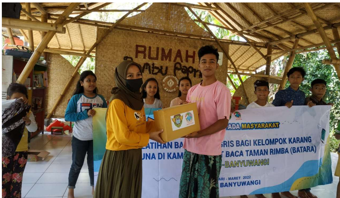
Gambar 4. Acara Penyerahan Hadiah kepada Kelompok Terbaik