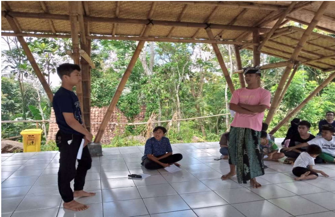
Gambar 3. Peserta Pelatihan Praktik Conversation Role Play