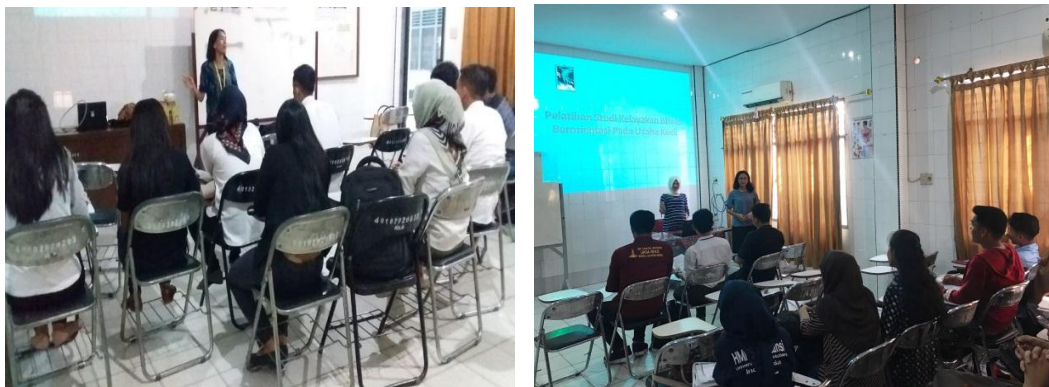
Gambar 1. Penyampaian Materi oleh Nara Sumber