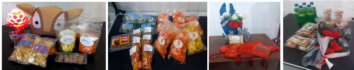
Gambar 2. Produk Bisnis Kreasi Peserta Seminar