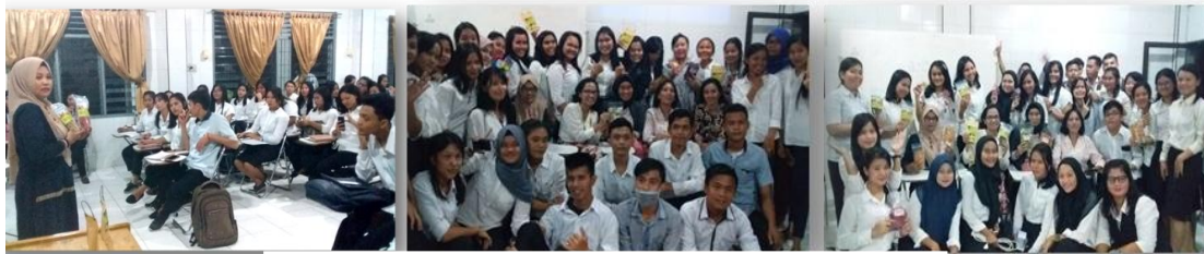
Gambar 1. Seminar Creativepreneurship

Untuk menjadi seorang wirausahawan dibutuhkan motivasi yang kuat serta kreatifitas dalam menciptakan ide-ide bisnis yang berpeluang untuk berhasil dijalankan. Sebelum adanya kegiatan pengabdian pada masyarakat ini, mitra merupakan sekumpulan kaum muda yang berpikir bahwa setelah lulus kuliah akan melamar kerja dan menjadi pekerja. Akhirnya mereka mulai menyadari bahwa karir dan kesuksesan seseorang dapat dicapai kapan saja bukan hanya menunggu kelulusan. Saat ini mereka dapat merintis sebuah bisnis untuk menjadi sukses. Serta lebih bermanfaat karena membuka lapangan pekerjaan bagi orang lain. Mereka pun mulai merancang bisnis mereka secara berkelompok dan menjalankannya.