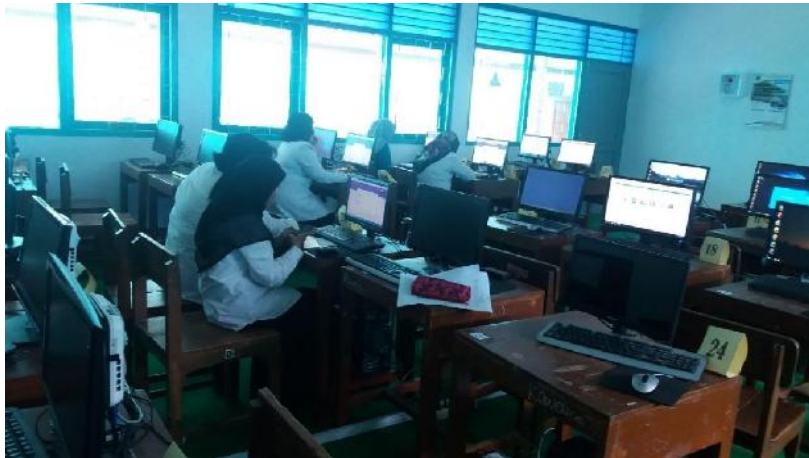
Gambar 3. Gambar praktikum peserta

Pada proses penyampaian materi, ini terbagi menjadi 4 proses, yaitu : ceramah materi pengabdian, praktik, diskusi, dan kuis. Waktu yang disediakan untuk ceramah materi pengabdian sebanyak 30 menit dan sisanya dilakukan praktikum, diskusi dan kuis. Disela-sela praktikum, pemateri sering memberikan kasus. Hal tersebut dilakukan untuk meningkatkan kreativitas dari peserta pengabdian.