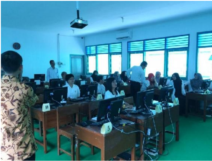
Gambar 2. Gambar pelaksanaan pengabdian

Pada proses penyampaian materi, ini terbagi menjadi 4 proses, yaitu : ceramah materi pengabdian, praktik, diskusi, dan kuis. Waktu yang disediakan untuk ceramah materi pengabdian sebanyak 30 menit dan sisanya dilakukan praktikum, diskusi dan kuis. Disela-sela praktikum, pemateri sering memberikan kasus. Hal tersebut dilakukan untuk meningkatkan kreativitas dari peserta pengabdian.