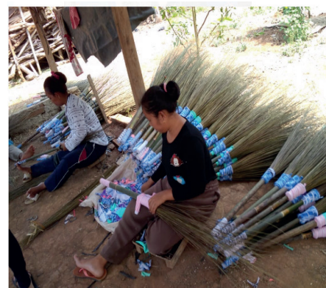
Gambar 1.2. pada saat wawancara

Wawancara ini dilakukan dengan cara berkunjung langsung ke tempat para pengrajin usaha khususnya kampung Benoa, dilakukan di siang hari pada saat para pengrajin melakukan proses produksi pembuatan sapu.