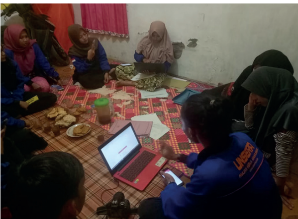
Gambar 1.5. Pelatihan blogspot pada pengelola dana desa

Pelatihan hanya diikuti oleh pengelola dana desa yang telah ditunjuk oleh kepala desa untuk mengelola dana desa dan pengembangan para pengrajin, lokasi pelatihan yang digunakan yaitu tempat mahasiswa kuliah kerja mahasiswa yang menjadi posko selama kegiatan berlangsung. Dalam pelatihan ini diharapkan pengelola dapat memahami lebih dalam dan mempersiapkan sarana yang dibutuhkan. Dapat dilihat pada pada gambar dibawah ini.