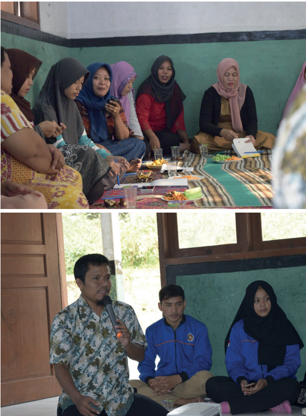
Gambar 1.3. pemberian materi tentang pemasaran