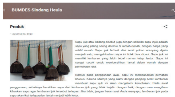
Gambar 1.7. https://bumdessindangheula.blogspot.com/2018/08/contact-us.html

Blogspot ini diberi nama BUMDES Sidang Heula karena yang yang melanjutkan blogspot ini adalah para pengelola dana desa yang sudah ditunjuk oleh Kepala Desa Sindang Heula. Dimana didalam blogspot tersebut terdapat profil desa dan produk yang telah dihasilkan oleh para pengrajin usaha.