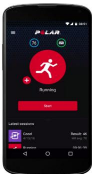
Gambar 2. Tampilan Aplikasi Polar Beat

Seperti yang telah dikemukakan sebelumnya, Polar H7 tidak memerlukan perangkat jam tangan Polar, namun dapat menggunakan perangkat mobile berbasis iOS ataupun Android melalui aplikasi Polar Beat. Aplikasi Polar Beat memiliki tampilan yang sederhana dan mudah digunakan. Selain itu terdapat fitur “pelatih pribadi” yang dapat membuat perencanaan program latihan hingga analisa dari hasil latihan. Kelebihan lainnya adalah pengguna dapat membagikan hasil latihannya kepada media sosial.