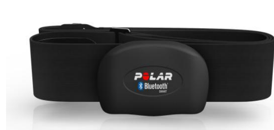
Gambar 1. Perangkat Polar H7

Heart Rate Monitor . Merk/Type: Polar H7