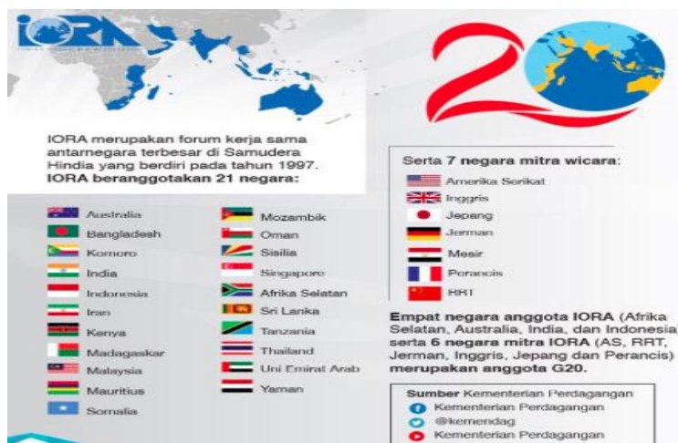
Gambar 2 – Negara Anggota IORA