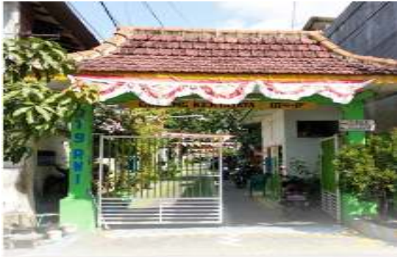
Gambar 7 One Gate System