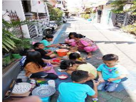
Gambar 9 Anak-anak Mainan Tradisional di Halaman Kampung