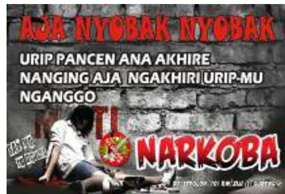
Sumber: Dokumen KP KAS Gubeng

Program ini melibatkan peran aktif semua elemen warga RW 01 bekerjasama dengan Puskesmas Gubeng yang menginginkan kampung dalam kondisi phisik, mental dan sosial merupakan satu kesatuan yang bebas dari penyakit/kecacatan dan menjadi kampung yang nyaman dan harmonis. Warga bersama anak-anak membuat pakta integritas kampung sehat, (1) berkomitmen menjadikan kampung sehat tanpa asap rokok, bebas miras dan bebas narkoba, (2) mewujudkan kampung yang peduli lingkungan ( Go Green ), (3) mewujudkan anak sehat yang bebas dari gizi buruk, tercukupinya imunisasi bagi balita dan membudayakan gemar cuci