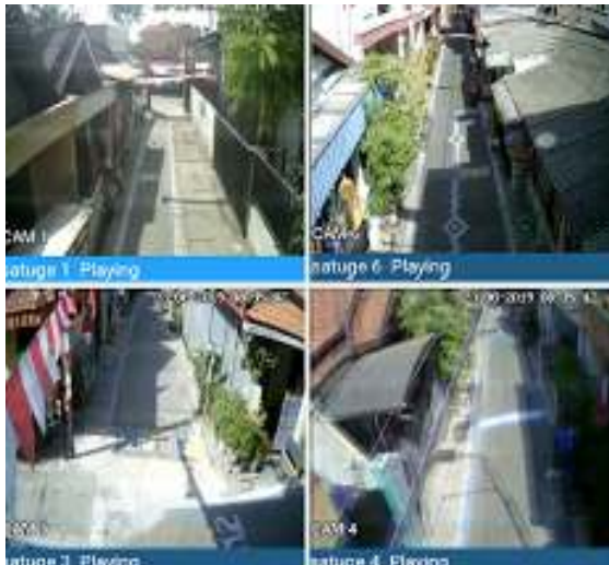
Gambar 8 Kegiatan Kampung Aman Akses CCTV ke HP Warga