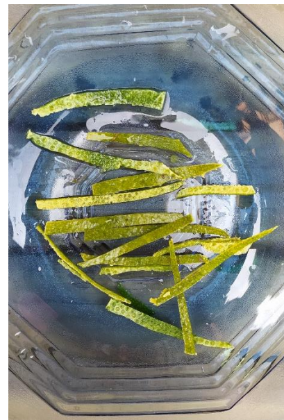
Gambar diatas merupakan kulit jeruk yang telah dibersihkan dan diiris tipis – tipis. Kulit jeruk ini memberikan rasa yang sedikit pahit pada orange marmalade juga berperan sebagai pengental atau perekat karena terdapat kandungan pektin didalamnya sehingga memberikan tekstur yang kental pada orange marmalade