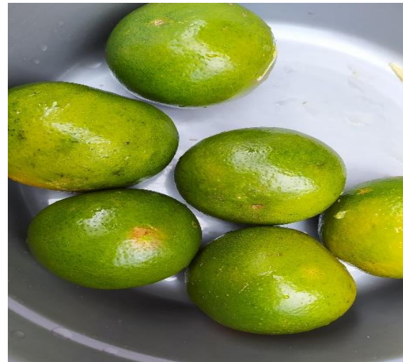
Gambar diatas merupakan jeruk khas Desa Kuok, dimana jeruk ini memiliki karakteristik rasa yang manis dan warna kulit yang kehijauan