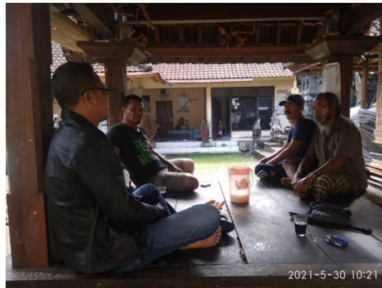
Gambar 3. Sosialisasi penerapan alat distilasi kepada mitra PKM