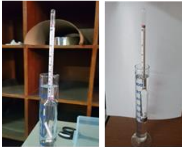
Gambar 8. Pengukuran kadar alkohol hasil distilasi

Adapun hasil diperoleh dari penerapan alat distilasi dengan termo kontrol adalah sebagai berikut: