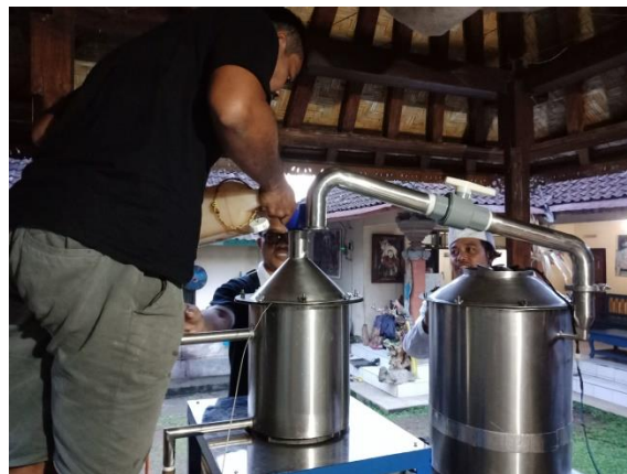
Gambar 6. Memasukan nira yang sudah dipermentasi ke dalam tunggu alat distilasi