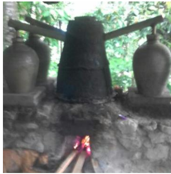
Gambar 2. Alat distilasi tradisional

Implementasi program kemitraan masyarakat (PKM) ini dilakukan dengan tahapan sebagai berikut :