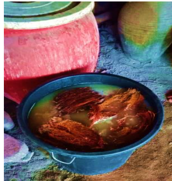
Gambar 5. Permentasi nira aren sebelum proses distilasi

dalam proses penyulingan/distilasi nira menjadi minuman tradisional. Melalui penerapan alat distilasi ini perajin minuman tradisional (mitra) mampu mempercepat waktu proses distilasi sebesar 1 jam dibanding dengan menggunakan alat distilasi tradisional. Bahan baku yang digunakan adalah nira dari pohon aren dengan perlakuan awal dipermentasi selama 6 jam dan 8 jam (Endah, Sperisa, & Nur, 2007). Sebelum dipermentasi nira aren di tambahkan dengan sabut kelapa yang telah dimemarkan dalam istilah Bali disebut "Lau". Lau ini ditampung dengan galon dan ditempatkan di area yng bersih dan teduh.