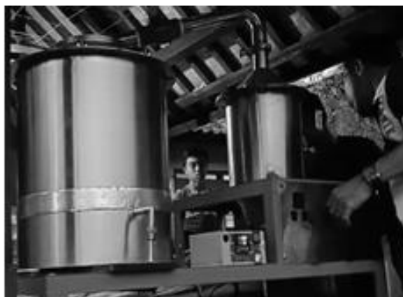
Gambar 4. Alat distilasi dengan thermo kontrol