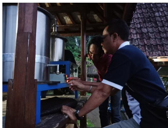
Gambar 7. Pengoperasian alat distilasi dengan alat pengatur temperatur pemanasan

Hasil distilasi dengan termokontrol memiliki kandungan alkohol mulai dari yang tertinggi sebesar 70% dan yang terendah 20%. Pengukuran kadar alkohol menggunakan alat "Alkohometer".