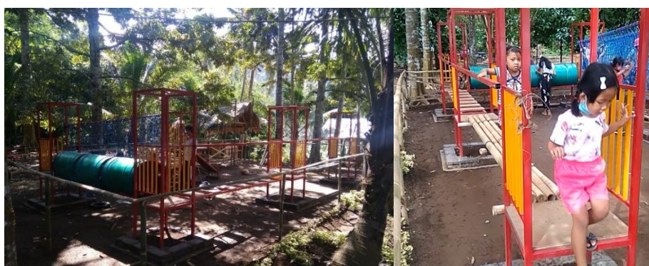
Gambar 4. Arena Permainan Edukasi Karakter