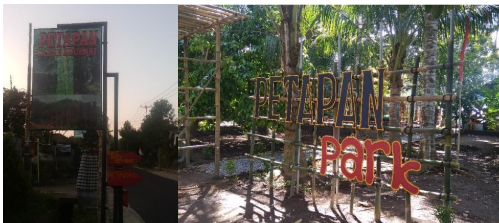
Gambar 2. Papan Penunjuk dan Papan Nama Objek Wisata

dari bahan multiplek dengan finishing cat. Papan nama ini dipasang di lokasi pengabdian dengan rangka dari bambu untuk menguatkan kesan green dan nuansa alam.