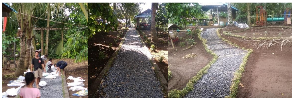
Gambar 5. Penataan Jalan Oleh Masyarakat

Penataan jalan dilakukan untuk memberikan kesan bersih serta tertib sehingga kelestarian dari lokasi dapat terjaga. Konsep ecofriendly menjadi acuan pengembangan infrastruktur kawasan objek wisata, sehingga bahan-bahan yang digunakan aman dan ramah lingkungan.