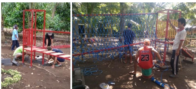
Gambar 3. Pembangunan Infrastruktur Wisata Edukasi Karakter oleh Masyarakat

Wisata edukasi yang sebelumnya sudah ada memerlukan sentuhan lebih lanjut, sehingga objek wisata yang telah terbentuk dapat dioptimalkan. Bentuk dari penguatannya adalah dibangunnya permainan karakter dengan tujuan untuk membangun karakter anak-anak sebagai subjek pendidikan yang nantinya memanfaatkan langsung lokasi taman edukasi. Karakter yang dibangun adalah rasa percaya diri, keberanian, disiplin dan siap menghadapi tantangan. Pemasangan permainan ini dibantu penuh oleh masyarakat khususnya pengelola objek wisata.