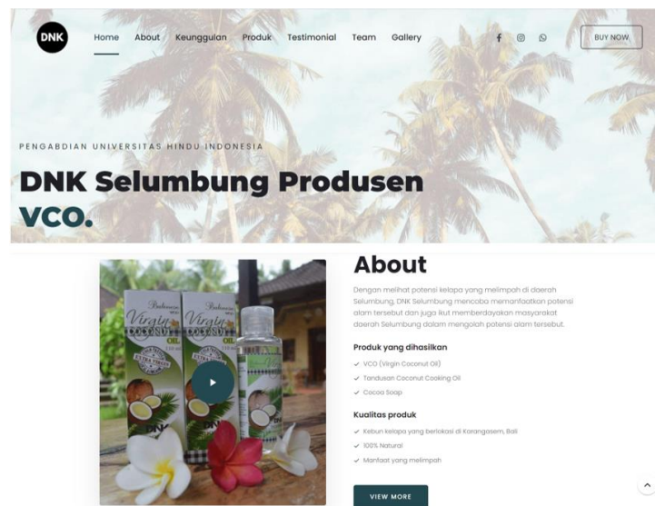
Gambar 2. Tampilan interface pada website DNK Selumbung

Adapun implementasi sistem informasi berupa website DNK Selumbung dapat diakses melalui tautan https://dnkselumbung.com/ dengan interface seperti Gambar 2.