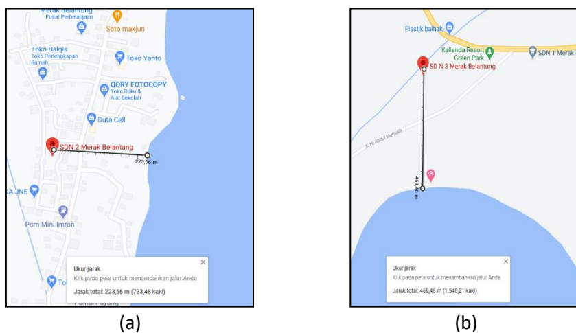
Gambar 2. Jarak lokasi sekolah dari pinggir pantai (a) SDN 2 Merak Belantung (b) SDN 3 Merak Belantung

SDN 3 Merak Belantung. Lokasi SDN 2 Merak Belantung dan SDN 3 Merak Belantung kurang dari 500 m dari pinggir pantai pada peta seperti pada Gambar 2 dan berada sekitar 50 km dari Gunung Anak Krakatau seperti pada Gambar 3. Hal ini bisa berpotensi menimbulkan bencana tsunami jika terjadi gempa bumi yang berpusat di laut atau ketika gunung anak Krakatau meletus. Oleh karena itu, penyuluhan mengenai bahaya gempa bumi dan dampaknya dirasa tepat dilakukan pada guru-guru SDN 2 dan SDN 3 Merak Belantung.