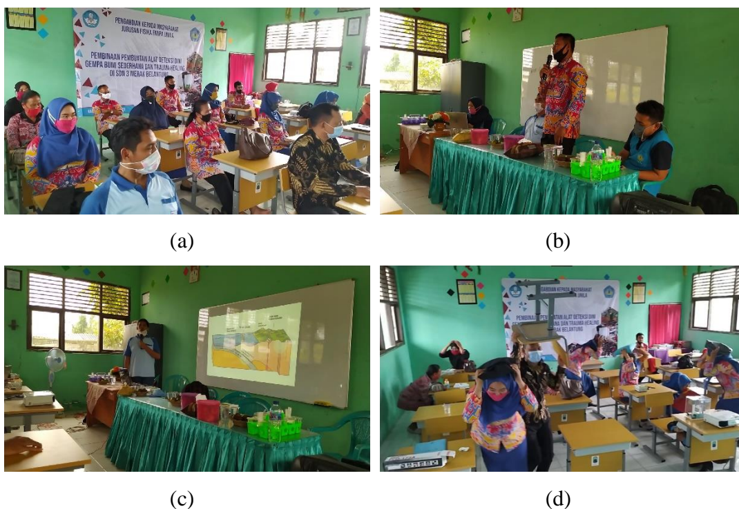
Gambar 4. Dokumentasi kegiatan (a) Peserta kegiatan (b) sambutan dari kepala SDN 3 Merak Belantung (c) Penyampaian materi oleh narasumber (d) Simulasi materi manajemen gempa bumi.

Sebelum dan setelah dilaksanakan kegiatan, peserta diminta untuk mengisi kuisisioner. Kuisisioner ini diberikan untuk menggali wawasan peserta dan tingkat kesiapan dalam menghadapi bencana. Dokumentasi kegiatan ditunjukkan pada Error! Reference source not found. Error! Reference source not found. (a) menunjukkan peserta kegiatan dengan tetap menerapkan protokol kesehatan. Kegiatan ini dihadiri oleh kepala SDN 3 Merak Belantung sekaligus memberikan sambutan dan dukungannya seperti yang ditunjukkan pada Error! Reference source not found. (b). Dalam kegiatan ini peserta dilibatkan aktif dalam setiap materi yang disampaikan, baik berupa diskusi Error! Reference source not found. (c) maupun simulasi Error! Reference source not found. (d).