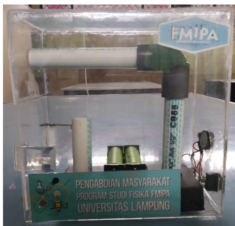
Gambar 6. Realisasi disain alat peringatan dini sederhana.

Peserta kegiatan telah memiliki pengetahuan yang cukup mengenai gempa, baik penyebabnya maupun bencana yang timbul akibat gempa bumi. Pengetahuan ini didapatkan dari radio, TV, sosialisasi/seminar maupun petugas pemerintah. Sebagian peserta telah menyiapkan beberapa hal untuk mengantisipasi terjadinya gempa bumi, seperti menyiapkan salinan dokumen, melatih siswa untuk menyelamatkan diri maupun meletakkan barang-barang berat ditempat rendah dan aman. Dari hasil kuisisioner yang dilakukan setelah kegiatan, lebih dari 80% peserta telah siap untuk menghadapi gempa bumi serta tahu apa yang akan dilakukan ketika gempa bumi terjadi. Selain itu, peserta kegiatan diberikan pelatihan trauma healing yang tidak berfokus pada kejadian yang berupa stress inoculation training (SIT). Pelatihan ini mengajarkan peserta beberapa cara untuk menghilangkan stress dan menjadi lebih rileks seperti belajar teknik pernapasan, memijat anggota badannya dan sebagainya. Hal ini diharapkan nantinya peserta pelatihan dapat melakukan trauma healing atau mengurangi trauma pasca bencana pada diri sendiri dan membantu orang lain sampai bantuan datang.