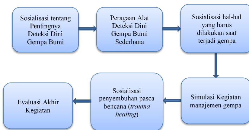
Gambar 1. Skema tahapan pelaksanaan pengabdian

peringatan dini sederhana. Materi penyuluhan dibuat dalam bentuk slide presentasi dan peragaan alat sehingga masyarakat memahami dengan baik mengenai proses pembuatan sistem peringatan dini gempa bumi sederhana. Tahap selanjutnya dari rangkaian kegiatan pengabdian ini ialah pelaksanaan kegiatan. Pelaksanaan kegiatan pengabdian dilakukan dengan dua metode utama yaitu penyuluhan dan praktik secara teknis. Penyuluhan dilakukan untuk memberikan pemahaman mengenai manajemen bencana sehingga peserta dapat memahami pentingnya untuk mengetahui bencana sejak awal dan hal-hal yang dilakukan sebelum, saat maupun setelah bencana gempa bumi terjadi. Praktik secara teknis ditujukan agar masyarakat dapat mengimplementasikan teknik pembuatan sistem peringatan dini sederhana. Tahap selanjutnya ialah evaluasi kegiatan. Evaluasi dilakukan dengan teknik diskusi dan pemberian kuisioner. Evaluasi dilakukan untuk mendapatkan umpan balik dari peserta mengenai tingkat kefahaman dan penerimaan peserta terhadap sistem peringatan dini sederhana serta kesiapan peserta dalam menghadapi bencana. Tahapan pelaksanaan kegiatan pengabdian ditunjukkan pada Gambar 1.