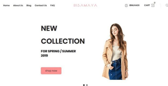
Gambar 2. Tampilan Homepage risamaya.com

Pelaksanaan kegiatan ini dilaksanakan mulai bulan Mei-Juli 2019. Hasil dari kegiatan pengabdian ini adalah website yang berfungsi sebagai media promosi dan penjualan di Risamaya Citra Indonesia. Domain dari website Risamaya Citra Indonesia adalah www.risamaya.com . Berikut tampilan homepage dari website Risamaya.