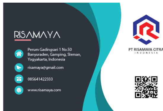
Gambar 5. Penyematan qr code sebagai bentuk diseminasi produk