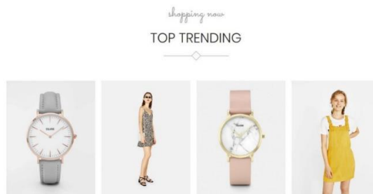
Gambar 3. Tampilan top trending

Fitur- fitur yang disematkan di website risamaya merupakan hasil identifikasi masalah dari mitra pengabdian. Fitur pendukung lainnya adalah pembeli bisa langsung melakukan order dan bisa langsung menanyakan ketersediaan barang ke penjual. Hal ini ditampilkan dalam gambar 4 dibawah ini.