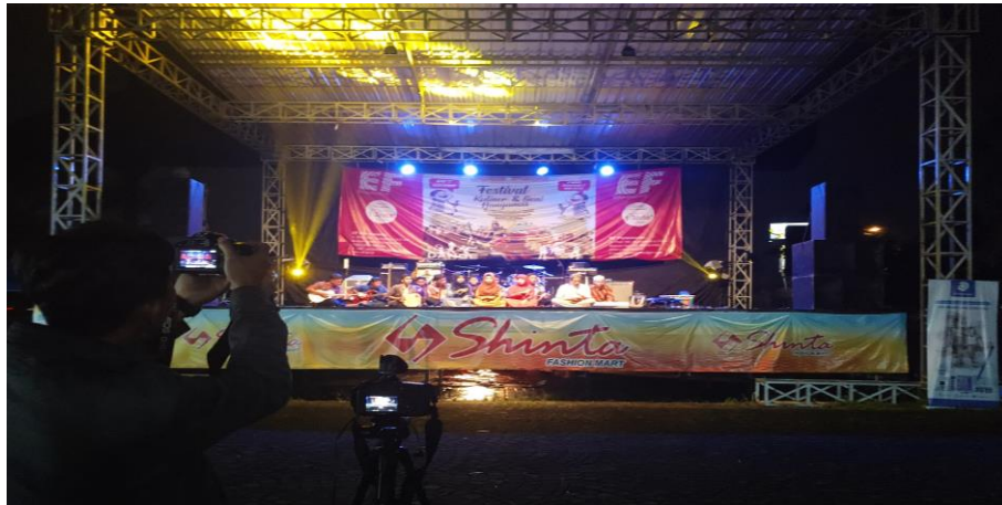
Gambar 2. Framing dan Camera Setting

pertama baca buku manual yang pada perangkat lunak editing secara menyeluruh. Kemudian mengotak-atik perangkat lunak untuk mempelajari semua fiturnya sebelum benar-benar melakukan editing. Selanjutnya mempersiapkan diri dan mulai melakukan editing.