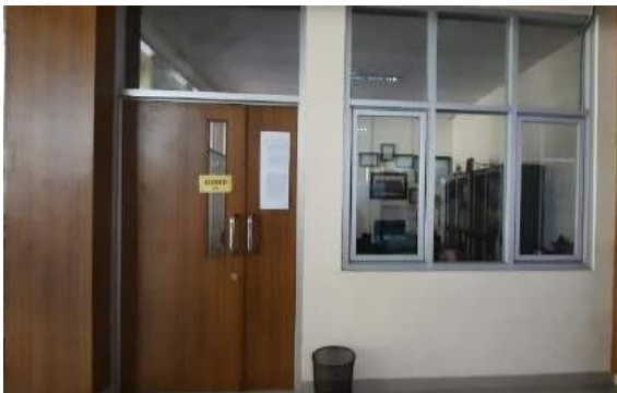
Gambar 1 TraveLab

kebutuhan industri pariwisata. Mahasiswa diberikan jadwal 1 sampai 2 kali dalam satu semester untuk piket di TraveLab dan melakukan praktek kerja di bidang tour and travel . Di TraveLab, mahasiswa dilatih dalam pembuatan paket wisata, penggunaan aplikasi reservasi baik akomodasi maupun transportasi, pemanduan, perencanaan sebuah event , pembuatan perangkat promosi pariwisata dan penyelenggaraan paket perjalanan wisata. TraveLab memberikan layanan pemesanan tiket transportasi darat dan udara, voucher hotel serta paket wisata. Dalam penyediaan paket wisata biasanya terintegrasi dengan tugas mahasiswa dalam perkuliahan. Tidak jarang juga paket wisata yang dibuat oleh mahasiswa dibeli oleh konsumen yang banyak berasal dari internal Polban. Selain itu, paket wisata yang disediakan oleh TraveLab juga terkait dengan kegiatan tour ataupun kunjungan industri mahasiswa Polban. Namun, saat ini sudah mulai banyak pemesanan paket wisata baik domestik maupun mancanegara.