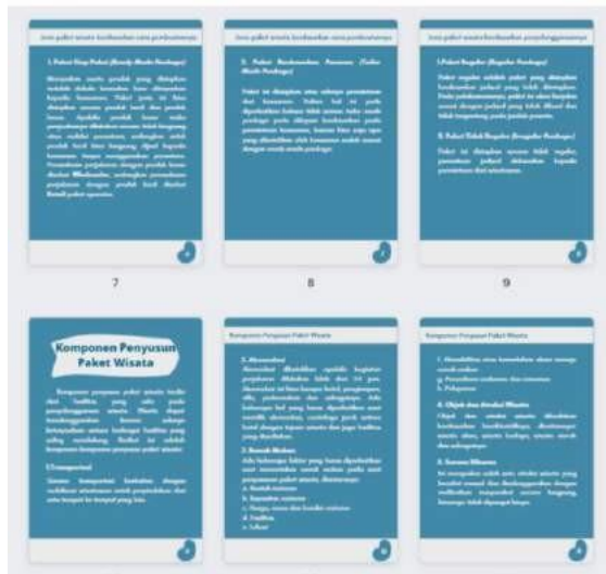
Gambar 6 Desain isi buku