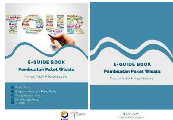
Gambar 4 Desain Cover depan dan belakang

Pembuatan desain menggunakan warna abu-abu dengan kode warna #ebeb, warna biru laut dengan kode #005A80, warna biru baja dengan kode #4089a8 dan warna putih dengan kode #ffffff. Pemilihan warna disesuaikan dengan gambar bertuliskan “TOUR” agar menjadi selaras. Pada desain cover ini juga menambahkan gambar yang bertuliskan kata “TOUR” dan tulisan tersebut terdiri dari nama-nama kota di seluruh dunia yang mengartikan luasnya sebuah perjalanan wisata. Jenis huruf yang Pada desain cover ini juga menambahkan gambar yang bertuliskan kata “TOUR” dan tulisan tersebut terdiri dari nama-nama kota di seluruh dunia yang mengartikan luasnya sebuah perjalanan wisata. Jenis huruf yang digunakan dalam desain cover ini adalah Raleway Heavy pada tulisan “E-GUIDE BOOK” dan “Pembuatan Paket Wisata” dengan ukuran huruf 32. Jenis huruf Raleway pada tulisan “TravelLab Politeknik Negeri Bandung” dan pada tulisan deskripsi mengenai isi dari buku panduan