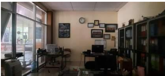
Gambar 2 TraveLab

Berdasarkan wawancara dengan Kepala Lab, saat ini TraveLab menyusun paket wisata berdasarkan pada permintaan klien atau berdasarkan pengumpulan tugas mahasiswa saat perkuliahan dan terkadang bekerja sama dengan perusahaan tour and travel lain untuk dibuatkan paket wisata yang kemudian dijual kembali. belum memiliki paket wisata yang siap digunakan ( readymade ). Selain itu, belum ada pula panduan pembuatan paket wisata yang dapat