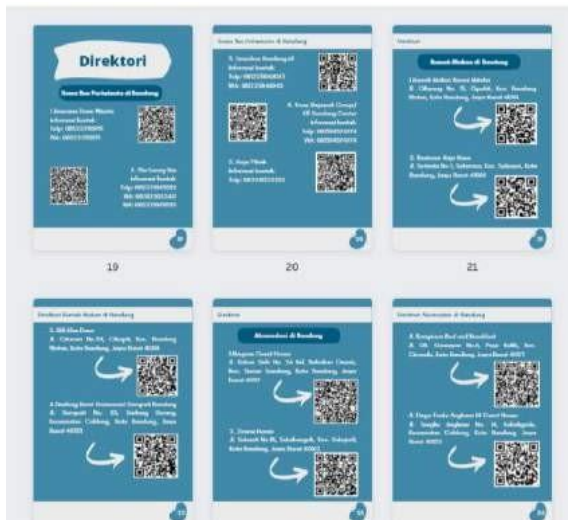
Gambar 8 Bagian direktori