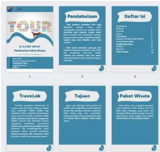
Gambar 5 Desain isi buku

dengan ukuran huruf 18. Selain itu, pada desain cover juga ada penambahan logo Politeknik Negeri Bandung sebagai identitas instansi tempat pembuatan buku panduan elektronik ini dan logo Wonderful Indonesia sebagai logo dari pariwisata di Indonesia. 2. Isi Konten Buku