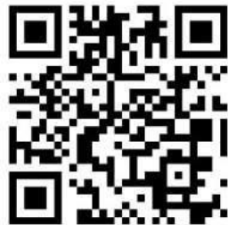
Gambar 9 QR Code buku panduan elektronik

Untuk melihat keseluruhan isi dari buku panduan elektronik ini, silahkan untuk scan QR code berikut ini: