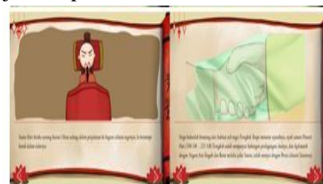
Gambar 5. Media Keterangan 2

Halaman media keterangan 2 digunakan untuk tampilan penjelasan dari setiap kegiatan pada sistem. Seperti yang ditunjukkan pada Gambar 5 di bawah ini: