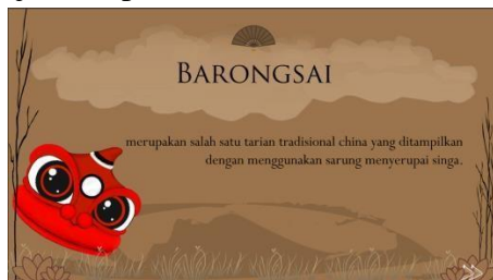
Gambar 3. Media Utama

Halaman media utama digunakan untuk tampilan awal sistem. Seperti yang ditunjukkan pada Gambar 3 di bawah ini: