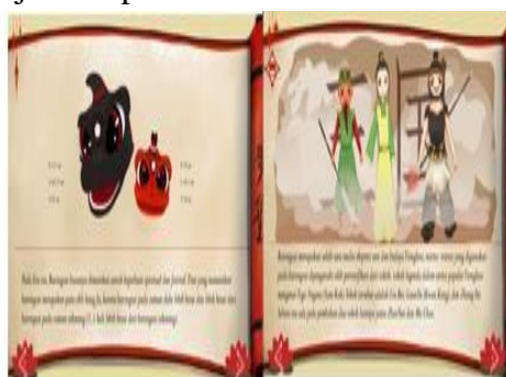
Gambar 6. Media Keterangan 3

Halaman media keterangan 3 digunakan untuk tampilan penjelasan dari setiap kegiatan pada sistem. Seperti yang ditunjukkan pada Gambar 6 di bawah ini: