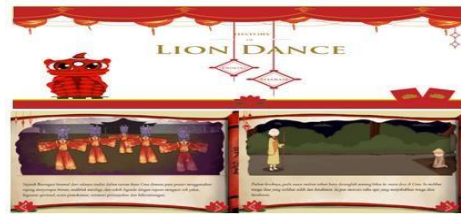
Gambar 4. Media Keterangan 1

Halaman media keterangan 1 digunakan untuk tampilan penjelasan dari setiap kegiatan pada sistem. Seperti yang ditunjukkan pada Gambar 4 di bawah ini: