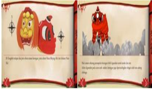
Gambar 7. Media Keterangan 4