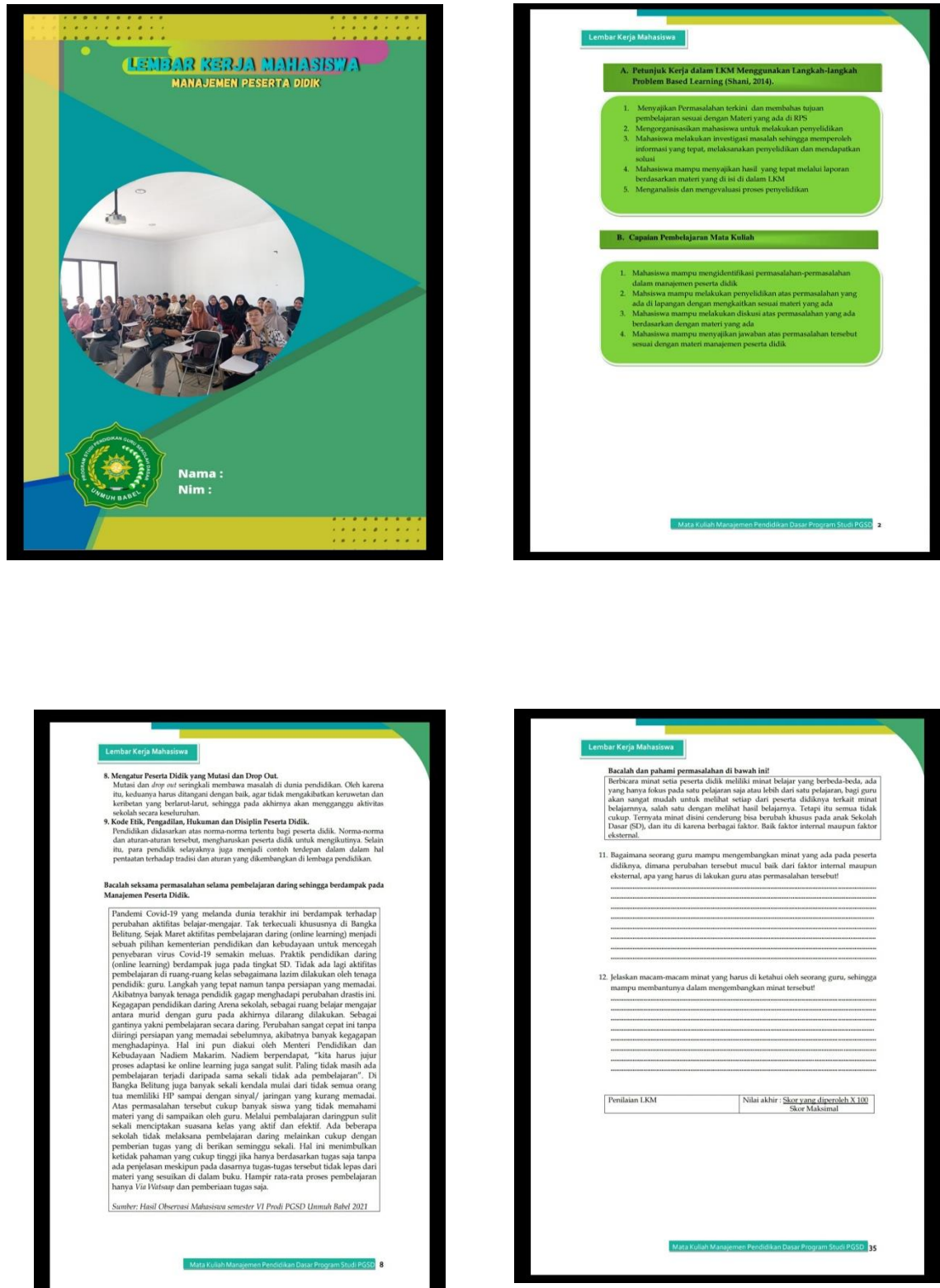
Gambar 2 Pengembangan LKM Berbasis PBL berbantuan e learning pada materi manajemen peserta didik

Berdasarkan gambar 2, produk LKM yang dikembangkan berdasarkan RPS mata kuliah manajemen pendidikan yang kemudian disesuaikan dengan langkah pada PBL. Setelah sesuai kemudian di sajikan melalui E-learning seperti gambar berikut.