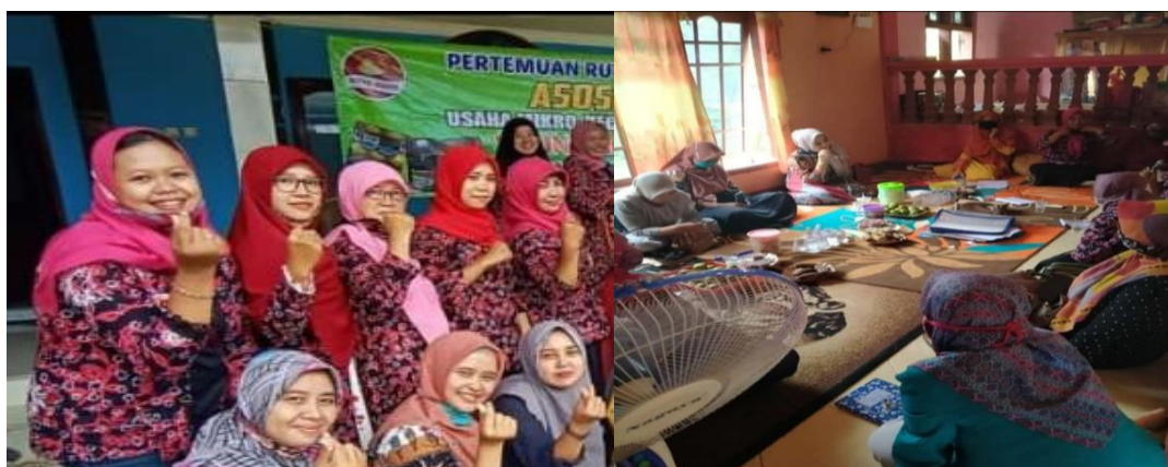
Gambar 5. Proses Pelatihan Penguatan Pengemasan Produk Batik

Hasil penguatan usaha yang dilakukan tim pengabdian terhadap pengrajin batik Banyuwangi, dengan penguatan usaha dengan melakukan pendampingan dan mencari mitra yaitu gallery-gallery batik yang ada di kota Banyuwangi. Sehingga dengan adanya mitra dapat meningkatkan penjualan produk kerajinan tangan batik yang dihasilkan, dan dapat memperluas pemasaran produk batik Banyuwangi Kecamatan Rogojampi Kabupaten Banyuwangi. Gallery-Gallery di tempat wisata dan kawasan Kota Banyuwangi akan mempermudah pengunjung dan konsumen untuk membeli hasil produksi pengrajin batik, misalnya toko oleh-oleh khas Banyuwangi. Pendampingan dan pelatihan dilakukan dua kali tatap muka dengan tiga sampai empat jam untuk setiap tatap muka. Berikut gambar proses diskusi dan pendampingan dalam upaya bermitra dengan pemilik gallery di Kota Banyuwangi.