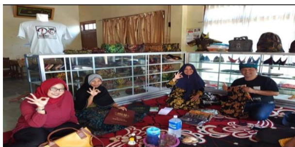
Gambar 4. Hasil Proses Pelatihan Diversifikasi Produk dan display

Berdasarkan upaya pelatihan diversifikasi produk dengan bahan baku kain batik yang dihasilkan, maka beberapa produk kerajinan yang dihasilkan oleh pengrajin batik Banyuwangi seperti: tas, sandal, gantungan lkunci. Udeng khas Banyuwangi, tempat tissue, dan lain sebagainya. Kreativitas hasil diskusi pengrajin dengan tim pengabdian menghasilkan produk-produk yang beragam, sehingga meningkatkan penjualan dan pendapatan pengrajin Batik Banyuwangi. Berikut gambar dari beberapa hasil kain batik yang dihasilkan dan produk-produk hasil diversifikasi batik Banyuwangi, serta display dagangan pengrajin batik Banyuwangi.