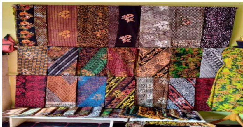
Gambar 1. Bahan Batik Yang dihasilkan pengrajin batik Kecamatan Rogojampi Kabupaten Banyuwangi

Banyuwangi memerlukan pendampingan pada lembaga pendidikan dan dinas terkait untuk mengatasi solusi dalam upaya meningkatkan pendapatan pengrajin Batik Kecamatan Rogojampi Kabupaten Banyuwangi. Berikut beberapa motif batik yang dihasilkan masyarakat (pengrajin) Batik Banyuwangi di Kecamatan Rogojampi Kabupaten Banyuwangi.