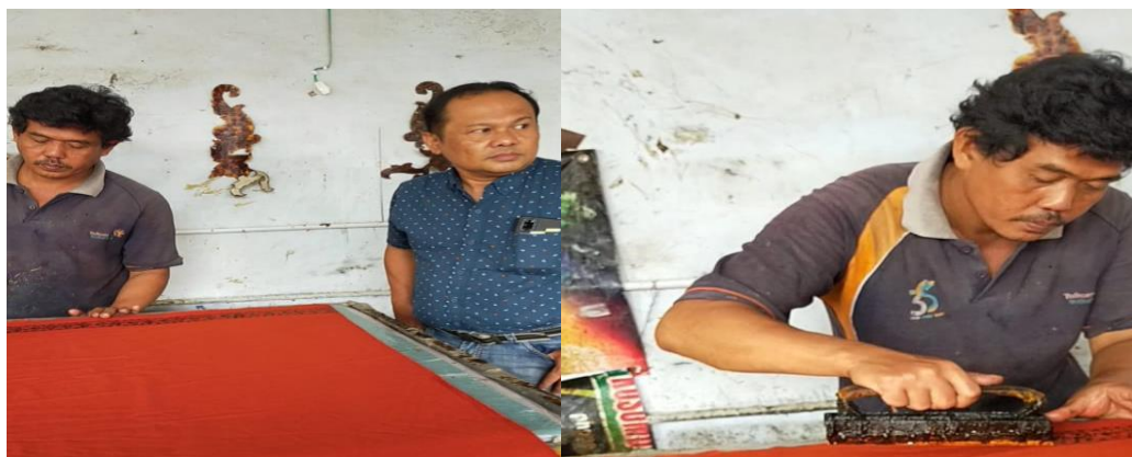
Gambar 3. Proses Percobaan alat stempel dengan modifikasi baru

Berdasarkan upaya yang dilakukan dalam tahap pertama, yaitu dengan meningkatkan produksi dengan mempernyak motif cap dan cap yang dimiliki pengrajin batik maka produksi yang dihasilkan pengrajin mengalami peningkatan dari sebelumnya. Hal ini dikarenakan, batik yang dihasilkan tidak hanya batik tulis namun juga batik cap dengan berbagai motif. Berikut gambar proses uji coba cap dengan motif baru yang dihasilkan hasil diskusi pengrajin dengan tim pengabdian masyarakat.