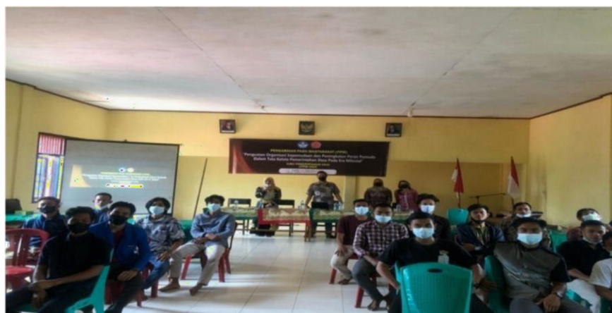
Gambar 3: Foto Bersama Peserta FGD

Pendampingan dilakukan dalam tiga sesi mulai penyusunan Job Description, penyusunan program kerja dan rapat kerja. Pendampingan penyusunan Job Description masing-masing bidang yang ada dalam struktur karang taruna Desa Tantan. Dengan adanya Job Description ini diharapkan masing-masing bidang yang ada dalam struktur organisasi memahami apa yang menjadi fokus pekerjaannya. Pendampingan penyusunan program kerja masing-masing bidang dilakukan dengan mendampingi seluruh bidang untuk melakukan rapat bidang dan menyusun program kerja masing-masing bidang yang akan dilaksanakan selama satu tahun. dan pendampingan dalam melakukan rapat kerja dalam proses pengesahan rencana kerja organisasi yang akan dilakukan oleh karang taruan Desa Tantan selama satu tahun.