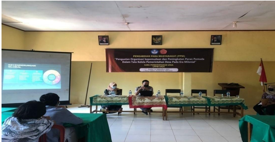
Gambar 2: Fokus Grup Discussions Pendampingan Penguatan Organisasi Karang Taruna

Berdasarkan hasil FGD yang dilaksanakan sebelumnya diketahui bahwa salah satu sebab ke pakuman organisasi karang taruna di Desa Tantan adalah tidak adanya rencana kegiatan yang akan dilaksanakan selama satu tahun. Tindak lanjut dari hal tersebut, tim pengabdian melakukan pendampingan sampai pada tahapan penyusunan rencana kerja karang taruna.