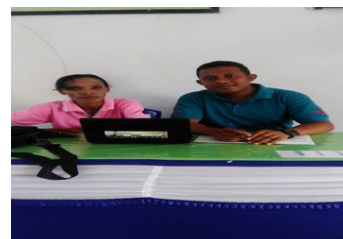
Gambar 3. Wawancara dengan Guru SD Kristen Manglusi

Kemudian ketika dilakukan konfirmasi dengan guru SD Inpres Manglusi (A.L) dikatakan bahwa “Selama ini belum pernah terjadi hal demikian yang dilakukan oleh pengawas”.