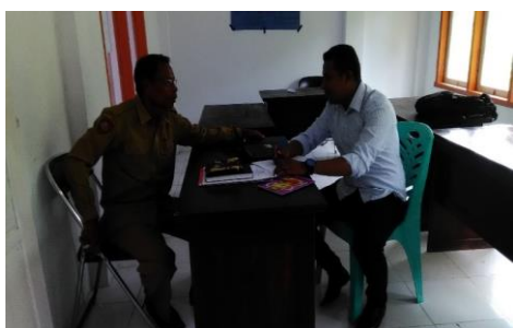
Gambar 1. Hasil Wawancara Dengan Pengawas Sekolah

Berdasarkan hasil wawancara dengan pengawas sekolah (L.B) terkait hubungan komunikasi antara pengawas dengan guru dikatakan bahwa “Komunikasi itu kadang-kadang kita melalui hp, misalnya besok mau lakukan supervisi berarti sebentar kita sudah hubungi besok pengawas ke sana walaupun mereka sudah baca program” di tambahakan pula oleh dirinya bahwa “Hubungan komunikasi antara pengawas dengan guru sangat baik, malah mereka itu ramah-ramah karena kita ajarkan pada mereka sehingga ada guru yang kita dapat dia tidak punya ramah maka kita panggil langsung kita tegur tidak boleh seperti itu karena itu tatakrma sudah mengatur”.