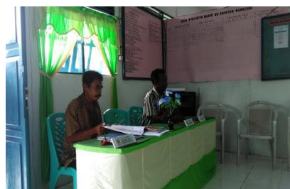
Gambar 2. Wawancara Dengan Guru SD Kristen Manglusi

Keterangan berbeda disampaikan oleh pengawas sekolah binaan (M.S) yang mengatakan bahwa “Cukup, tidak terlalu baik dan tidak terlalu buruk”. Sedangkan keterangan berbeda di sampaikan oleh guru SD Kristen Manglusi (Y.E) ketika dilakukan wawancara mengatakan bahwa “Pengawas Sekolah Dasar di Kecamatan Nirunmas ini memiliki SDM yang berbeda, ada yang baik tetapi ada juga yang kurang, karena mereka tidak pernah mengikuti pelatihan. Kecuali pengawas SMP sehingga dalam melaksanakan tugasnya kadang di pengaruhi oleh faktor SDM dari pengawas itu sendiri”