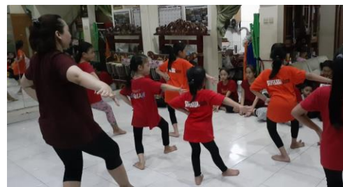
Gambar 1. Proses Pembelajaran Tari Jaipong Pada Anak Usia 7-9 Tahun

pertemuannya yaitu meliputi penghafalan dan ketepatan gerak dengan tempo irama iringan tersebut. Biasanya sanggar Supukaba melakukan evaluasi secara besar dengan menggunakan teknik pasanggiri atau lomba tari jaipong dengan bertujuan untuk mengasah kepercayaan diri peserta belajar, namun dikarenakan adanya pandemi Covid-19, evaluasi besar belum bisa dilaksanakan. Aspek penilaian dari setiap evaluasi yaitu penguasaan terhadap Wiraga , Wirahma , dan Wirasa .